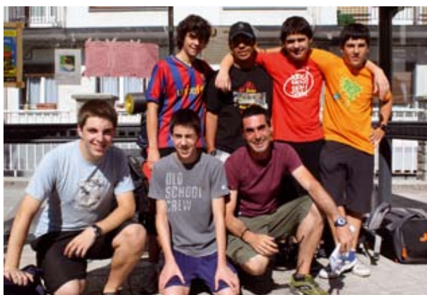
Kosta ala kosta udalekuetan parte hartu duten herritarrak.

Atxolin Guraso Elkartek antolatu dituen ingelesezko udalekuetan 16 umek eman dute izena. Adinaren eta ezagutza mailaren arabera bi taldetan banatu dituzte umeak eta egunean ingeleseko ordubate jasotzeaz gain ekimen ugari ere egin dituzte: Bergarako igerilekura joan dira, Ezozin "altxorraren bila" jokua egin dute eta Osintxuko bidegorrira ere joan dira esate baterako, den-dena ingelesez eginez.