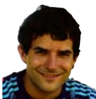
Aitor Morillo Mamu bizia

G aur mamu bati buruz hitz egingodizuet. Mamuhonek izen propioa du eta harrapatzen zaituenean izua hedatzen du, bai kaltetuarengan baita bere ingurukoengan ere. Mamu honen izena MINBIZIA da.