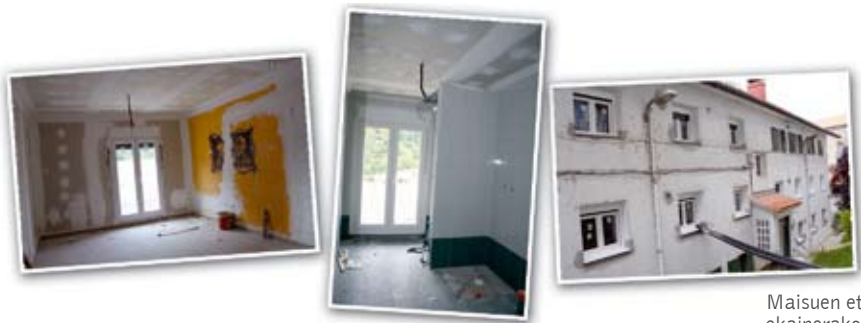
Maisuen etxeak ekainerako erabilgarri egotea aurreikusten da.

Udalaren eta Soralezeko Futbol Taldearen arteko hitzarmena onartu zuten Udal Gobernu Taldearen eta EAJ-ren aldeko botuekin; PP eta PSE abstenitu egin ziren. Hitzarmenari esker, besteak beste, herritarrek bertako instalazioak erabili ahalko dituzte futbol taldeek bertan jokatzeko ez duten sasoiak. Azkenik, etxeko laguntza zerbitzuko erabilizaileen artean botikeren erabilera optimizatzen duen programa garatzeko, udalaren eta Gipuzkoako Botikarien Elkargoaren arteko lankidetzaren hitzarmena aho batez onartu zuten zinegotziak.