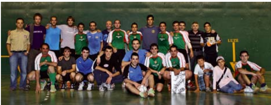
Iazko finala jokatu zuten taldeak

ko dira, kiroldegian bertan. Talde guztiek izena emandakoan zehaz- tuko dute egutegia baina aurreratu duenez, egutegia finkatzen denean ezin izango dira partida egunak al- datu. Lehiaketa hau udaleko kirol sailak antolatzen du.