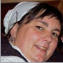
Itziar Buruntza Maiatzan 6xan! Muxu eta besarkada bero bat, Karropotes kuadrillian partez!