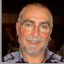
Pedri Lete Maiatzan 16xan 58 urte! Ondo-ondo jarraitu eta muxu handi bat!