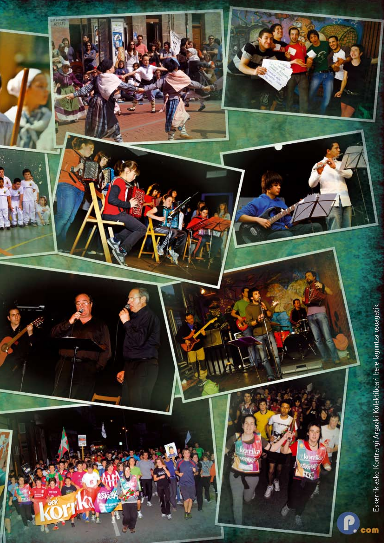
Eskerririk asko Kontrargi Argazki Kolektiboari bere laguntza osoagatik.