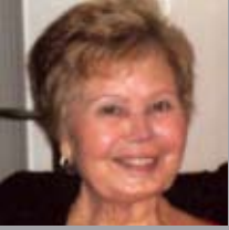
Zorionak amama! Otsailan 71 urte betetzen ditzuzelako! Zure seme, bilobe eta errainan partez, muxu haundi bat!!