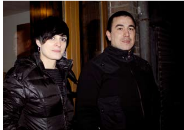
Etxepea duela hamar urte erosi zuten.

Ez, etxepia baino, lelengo pisu baten antzera dago alturaz. Eraikinian guztira zazpi pisu egin zituen baina sei egiteko baimena zeukela eta, etxebizitza pilotu moduan erabiltzen zebe gure etxia. 89 metro karratu inguru daukaz eta paretik bareko lokal karratu bat zan hasieran. Baimenak lortu eta obria egittiari ekin gontsan.