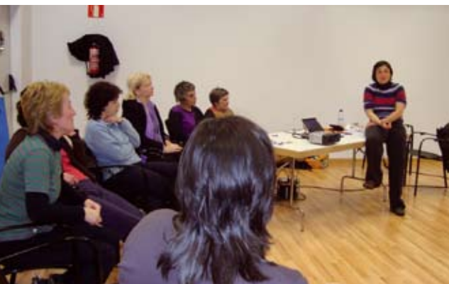
Irudian autodefentsa ikastaroa.