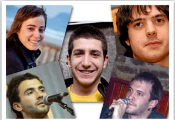
Santa eskean baserriz baserri ibiliko dira bertsolariak