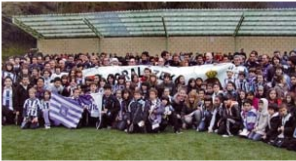
Soraluzeko zaleak Errealeko jokalariekin

Urtarrilaren 18an Errealak Ezoziko futbol zelaian entrenatu zuen. 10:30ak aldean azaldu zen txuri-urdinen autobusa eta ordurako harmailak beteta zeuden. Autobusetik banan-banan agertu ziren klub gipuzkoarreko jokalariak eta ordezkarriak. Gero talde argazkia atera zuten jarraitzaile, Sorako ordezkarri eta beste hainbeste jenderekin.