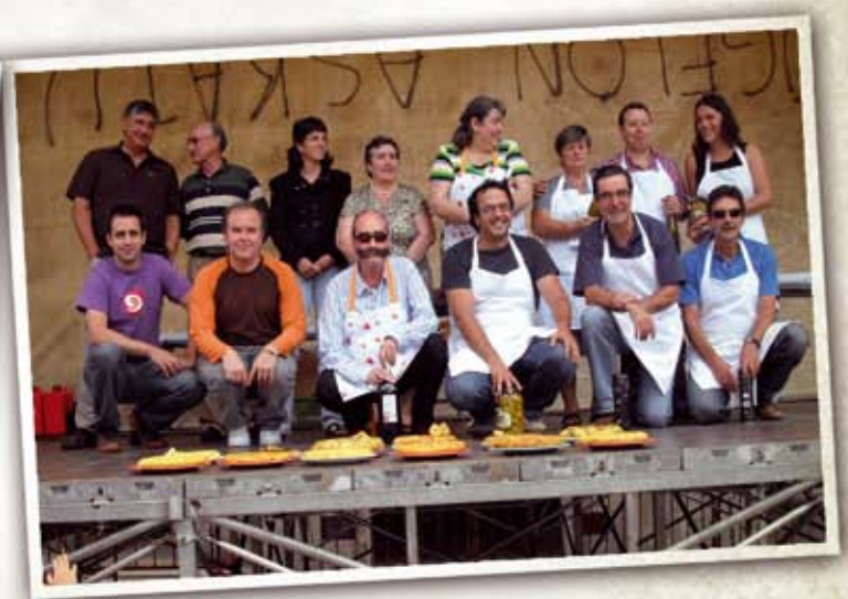
08 Abuztua Andramari jaixak: Abuztuko ospakizunen artean Andramariak ospatu zituzten herrian. San Roke eguneko tortila txapelketa izan zen ekitaldietako bat.