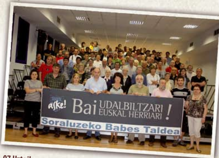
07 Uztaila Udalbiltzak herritarren babesa jaso zuen: Auzipetutako 22 lagunei babesa eman zion Soraluzeko Udalbiltzaren aldeko babes taldeak argazki baten bitartez. Osoko Bilkuran ere babes mozio bat aurkeztu zuten "Bai Udalbiltzari, Bai Euskal Herriari" plataformaren izenean.