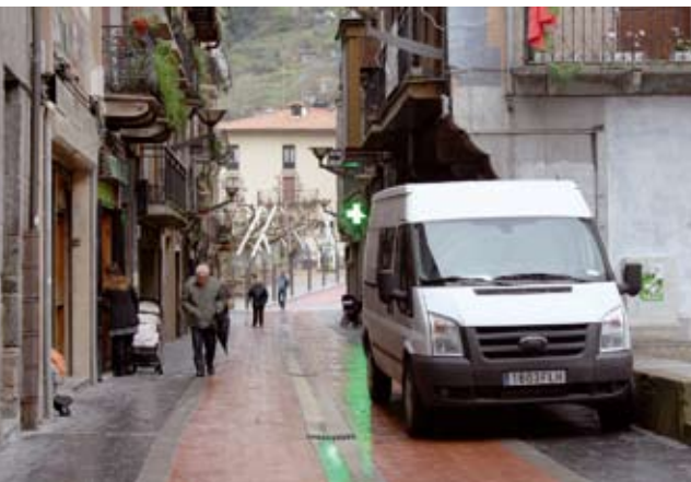
Peatonalizazioarekin Kalebarren ere itxita egongo da.

Elena Tabernaren film dokumentala eta eztabaida. Urtarrilak 26, eguaztena, 19etan Zinean.