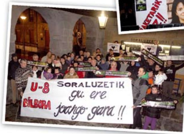
Bilboko manifestaziora joateko deialdia.

AAMk Gabonetarako prestatu duen egitaraua aurkeztu zuen. Gabon egunean 19:30ean Olentzerorekin manifestazioa egingo dute eta gauean "Hator hator gaba" ospatuko dute Arrano tabernan. Hilaren 26an Martutenera martxa antolatu dute eta bertara joateko asmoa dutenek, Erregetxean agertu beharko dute goizeko 10:00etan. Urte zahar egunean berriro, presoan aldeko elkarretaratzeko berezia egingo dute, arratsaldeko 20:00etan Plaza Barrixan eta goizaldeko 01:00ean berriz brindisa egingo dute bertan. Urtarrilaren 8ko manifestaziora joan nahi dutenek, Arrano, Gaztetxe edo Gaztelupe tabernetan eman beharko dute izena.