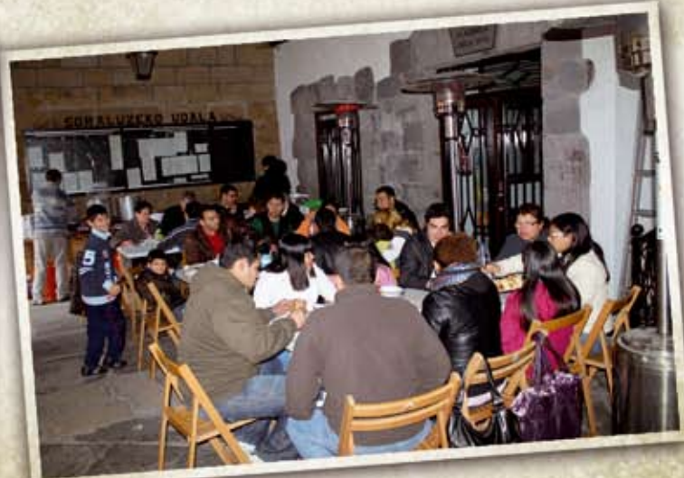
12 Abendua Jantoki herrikoia antolatu zuen Elkartzenek: Gabonetako kontsumismoari eta pobrezia aurre egiteko, jantoki herrikoia eta truke azoka antolatu zituen.