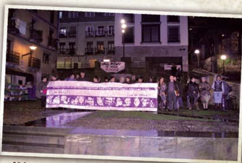
11 Azaroa Bost emakumek tratu txarrak salatu dituzte: Azaroaren 25aren harira jakin genuen datu larria. Baita aurten, beste zortzi emakumek asistentzia psikologikoa jaso dutela. Indarkeria salatzeke elkarretaratzea egin zen herrian.