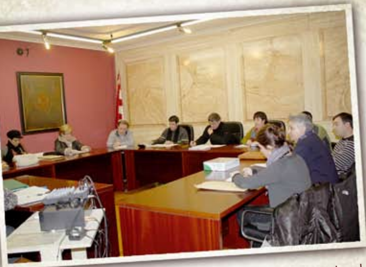
03 Martxo Aurrekontuak onartu egin ziren: Bi urtez 2007ko aurrekontuak molidatzen ibili eta gero, zinegotziek urtean urteko aurrekontuekin egin ahal izan zituzten 2010eko diru aurreikuspenak. Iaz baino 1.782.262 euro gutxiago egon da aurten.