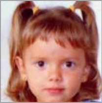
Garazi Jule Catalan Abenduan 29xan 11 urte! Zorionak eta muxu haundi bat familixakuen partez!