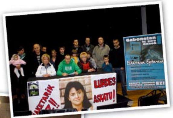
Barrixakuan egindako prentsurrekoak.