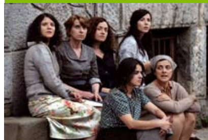
Filmeko irudi bat