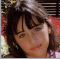
Ane Moreno Oya Azaruan 16xan 10 urte! Zorionak pila-pila maitte zaituan familixian partetik!