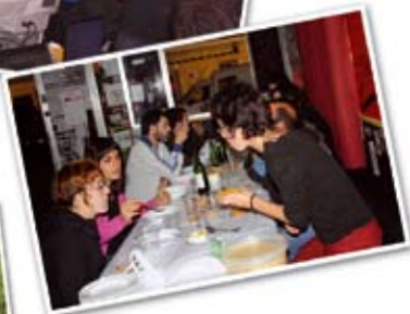
Iazko burututako zenbait ekintza