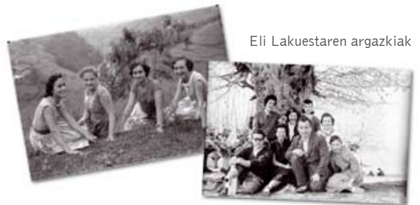
Eli Lakuestaren argazkiak