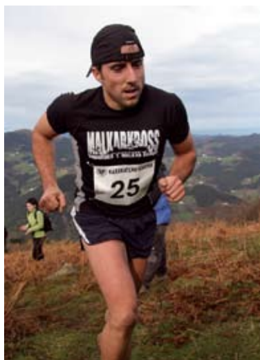
Orbe tontorrera bidean

Joan zen zapatuan Elgoibarko Morkaiko Mendizale Elkar- teak antolatzen duen Karakate- ra Igoera jokatu zen. Ateri eta mendigaina jendez lepo zegoela Elgoibarko Plaza Handitik ekin zuten lasterketa antxixikariek,