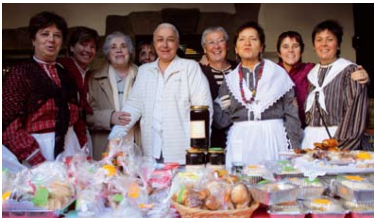
Misio Taldeko kideak

Taldeko arduradunek jakinarazi dutenez abenduaren 10etik 21era bitartean, Santa Ana kaleko Chip eta Chop dendan (gaur egun ez dago erabilgarri), bidezko merkataritzako produktuak salduko dituzte; Perutik, Ekuadorretik eta Mexikotik zuzenean ekarritako produktuak hain zuzen ere. Eskulanak eta bitxiak izango dira eskuragarri, besteak beste.