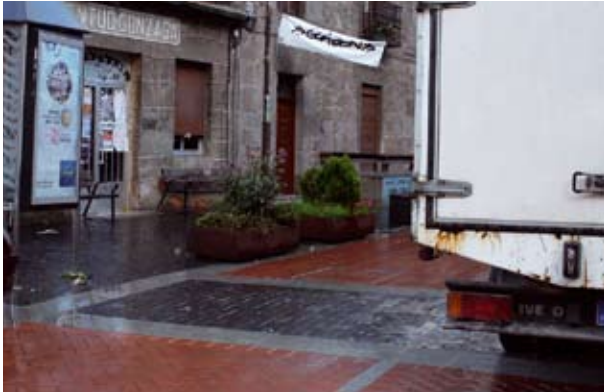
Udalak hemen kokatuko du aipatutako pibota hidraulikoa.

Udalaren proposamen honek berritasunak ekarriko ditu zenbait arlotan. Besteak beste, egueneko merkatua Erregetxetik Plaza Zaharrera pasatuko da, Erregetxeko aparkaleku denak koitxeentzat erabilgarri egoteko.