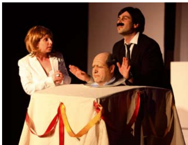
Bibotedun politikariarena egiten du Eduk.

"Vuelve bigotillo vuelve" Bilboko Campos Eliseos Antzokixan estreinatu genduan eta nere-