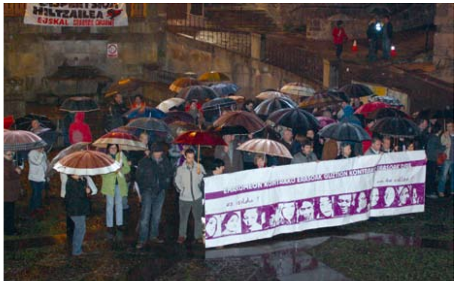
Iazko azaroaren 25ean egin zen elkarretaratzea