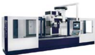
Mahai Mugikorreko Fresatzeko Zentrua