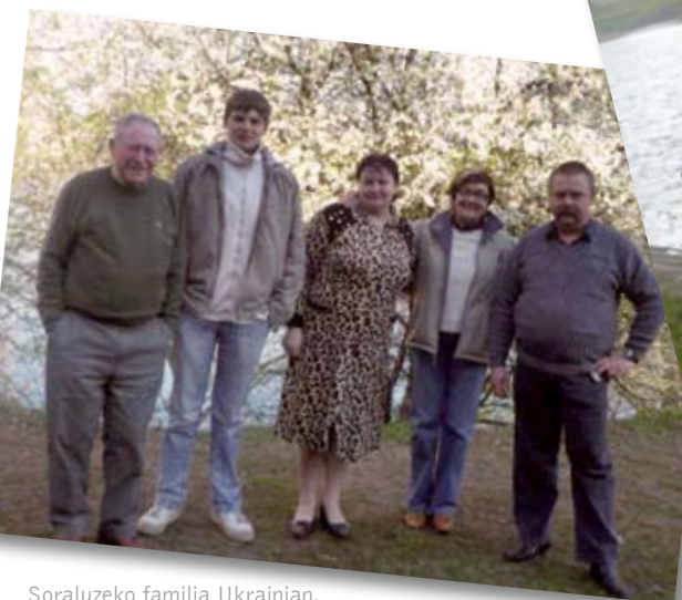
Soraluzeko familia Ukrainian.