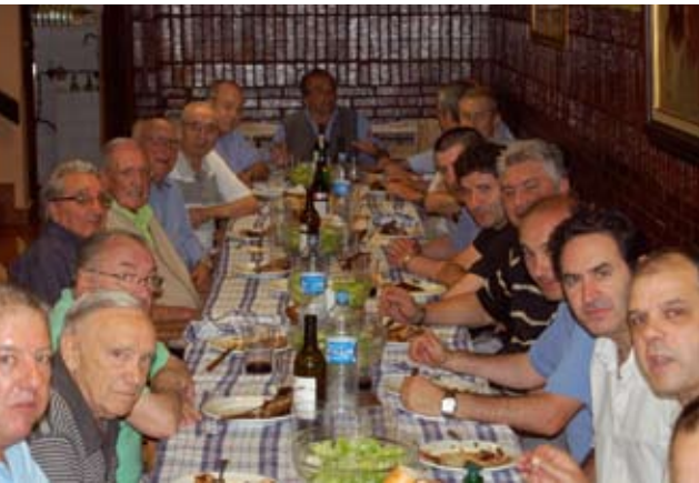
20 bat lagun izan ziren bazkaltzen.

A llegro Elkartek 50. urtebetzea ospatzen jarraituko du asteburu honetan. Eguerdiko 12:00etan bazkideek kalejira egingo dute herrian zehar buruhandiek lagunduta. 13:30ean oraingo bazkideen talde argazkia aterako dute Plaza Barrixan eta 14:00etan bazkide denek, herriko hainbat elkarteko eta udaleko ordezkariekin batera, bazkaria egingo dute Allegro Elkartean bertan.