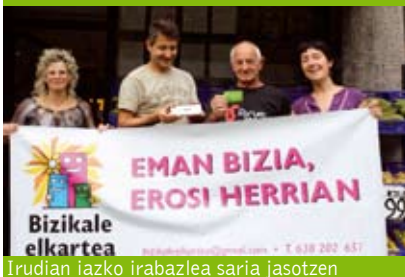
Irudian itzako irabazlea saria jasotzen

Bizikale Merkatarik Elkartek zozketa ipini berri du martxan. Elkarteko dendetan erosketak egiten dituztenen artean 50.000 errifa banatuko dituzte. Uztailaren 15ean zozketa egingo da eta zenbaki irabazleak 500 euro jasoko ditu elkarteko dendetan gastatzeko.