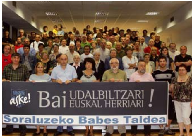
Sorluzeko Babes Taldea

Aipatutako Udalbiltzaren aldeko babes taldeak herritar denei deialdia egin nahi die uztailaren 15ean, eguena, arratsaldeko 19:30ean Plaza Barrixan egingo den elkarretaratzean parte hartzeko. Elkarretaratzearen leloa, "Bai Udalbiltzari, bai Euskal Herriari" izango da.