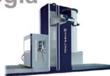
Zutabe Mugikorreko Fresatzeko Zentrua