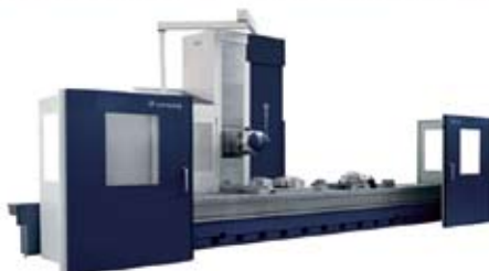
Zutabe Mugikorreko Fresatzeko Zentrua Mahai Finkoarekin