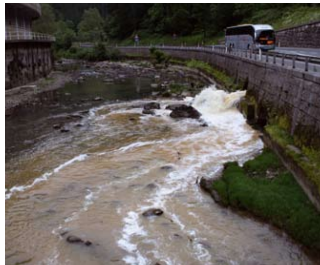
Ekainaren 3an horrela etorri zen ibaia.

Plana abian bada ere, azken asteetan Deba ibaiak kolore marroixka duela igaro du herria. Azkenekoz joan zen astean.