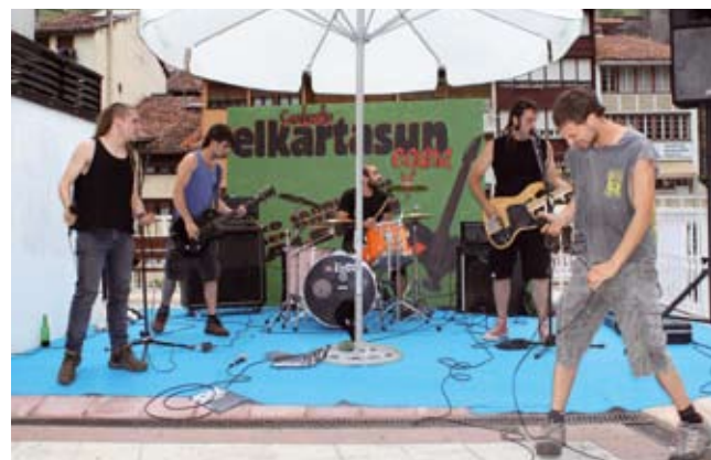
Kaosarenasoak Elkartasun Eguneko kontzertuan