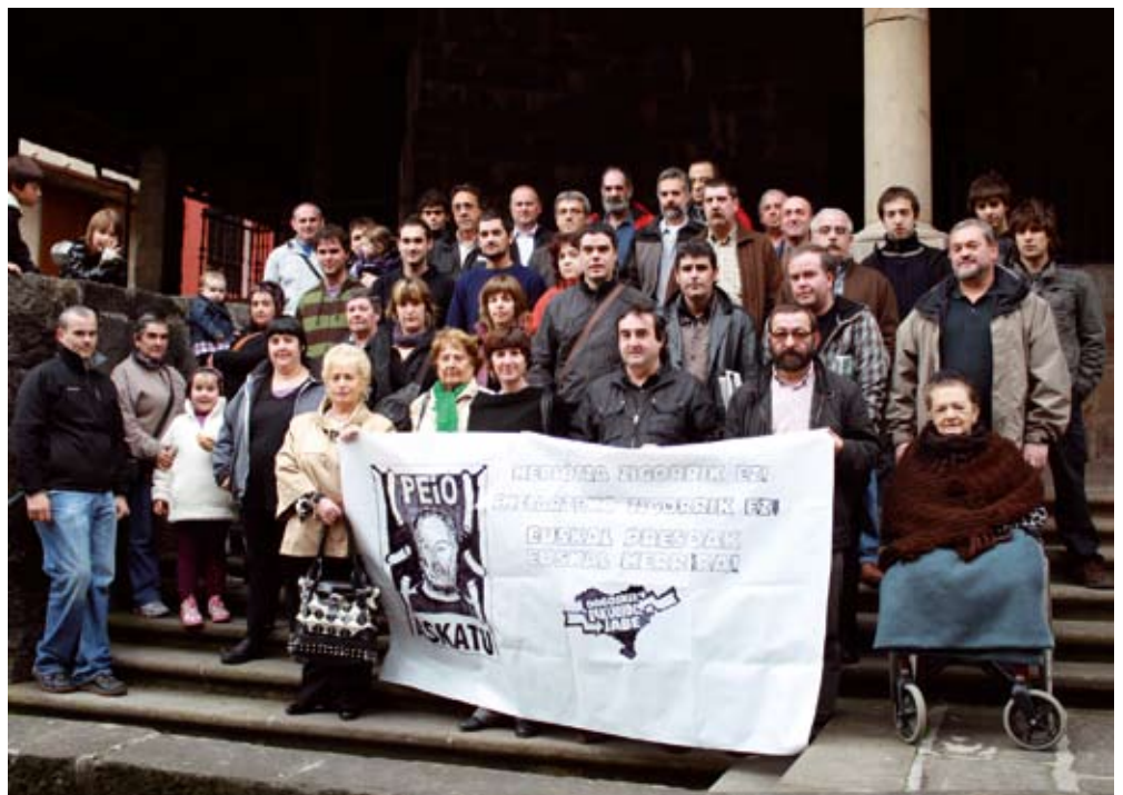
Herriko eragile eta norbanakoek 2009ko maiatzean preso politikoei elkartasuna adierazi zieten.

Elkartasun Eguna ekainaren 5ean Herriko Euskal Preso eta Iheslariari babesa eta elkartasuna eskaintzeko asmoz, Elkartasun Eguna antolatu du Sorluzeko Elkartasun Eguneko lan taldeak. Grafitiak, joaldunak, haurrentzat jolasak, puzgarriak, bazkari herrikoia eta ekitaldia izango dira besteak beste. Kontzertuak ere ez dira faltako. Egunez, Puskaila & Uekillo, Kaosarenasoak, Klabo Oxidado, Napoka Iria eta Elektro Txaranga taldeak arituko dira eta gauz berriz, Armyarma, Oren bi, Governors, DJ Papi eta Titino talde eta DJak. Bazkarirako tiketak 20 euro balio ditu eta Gaztelupe, Arrano eta Gila tabernetan daude salgai.