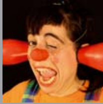
Wenpi Zorionak prexioxa!! Txoruana urte asko askuan egin deizula... Muxu haundi haundi bat denon partez.