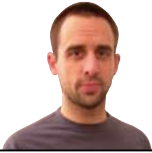
Unai Larreategi Europa kiebran?

E goera ekonomiko orokorra ez omen dago txantxetarako. Lehenengo atzeraldi ekonomikoaz hitz egiten hasi ziren, gero krisiaz eta orain hara non estatu batzuk zorrak ezin ordainduta kiebrara joateko arriskuan omen daude.