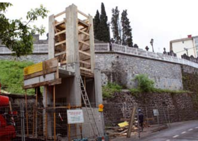
Hainbat bizilagun igogailua ipintzearen aurka agertu dira.

Auzokideen kexuei bide emanez Hiru alderdiek azaldu zuten, aipatutako kaleko bizilagunen kexei bide emateko ipini zuten mozioa. Igogailua bi etxaurreren artean igaroko da eta etxaurre horietako bateko leihoak igogailura begira geratuko dira. Hainbat bizilagunek idatziak aurkeztu dituzte eta hirigintza batzordeetan parte hartu dute, igogailua inpaktu handiegia dela iritzita. Udal Gobernu Taldeak adierazi du igogailuaren lanen dirulaguntza eskaera, kontratazioa eta obren esleipena hiru aldiz pasatu dela Osoko Bilkura ezberdinetatik eta hiruretan aho batez alderdi denek onartu dutela. Azkenean, 2010eko martxoaren 10ko Udaltzarrean obren hasiera aho batez onartu zutela ere aipatu du Udal Gobernu Taldeak.