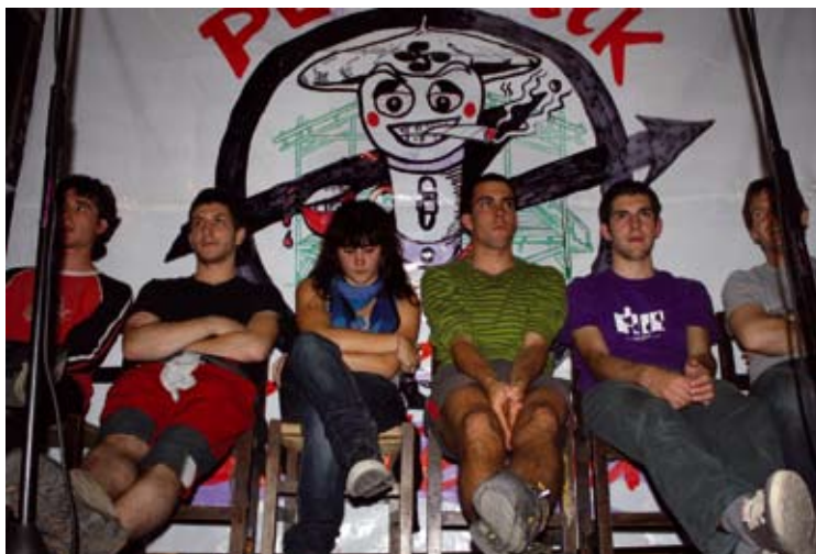
Iazko Plazatik Gaztetxera bertso txapelketako kanporaketaren irudia.

Soraluzetik Mendarora pasako da txapelketa maiatzaren 21ean eta Elgoibarren maiatzaren 28an egingo da. Azken geltokia Mutrikuko gaztetxea izango da eta bertan erabakiko da irabazlea.