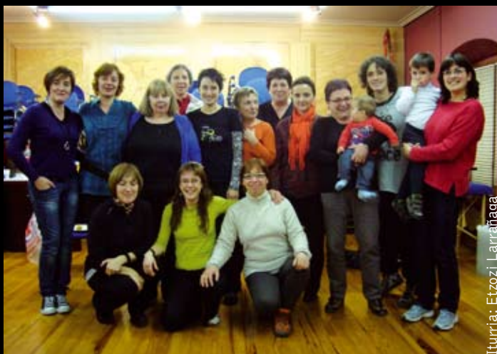
Iturria: Etzoz Larrainaga

Udaleko Emakume Batzordeak antolatuta zoru pelbikoa lantzeko ikastaroa egin dute 30 eta 58 urte arteko hamahiru emakumek. Guztira 12 orduko ikastaroa izan da eta sexu organueta giharrak landu eta indartu dituzte. Parte hartzaileak oso gustura agertu dira eta berriz ere errepikatuko dutelakoan daude.