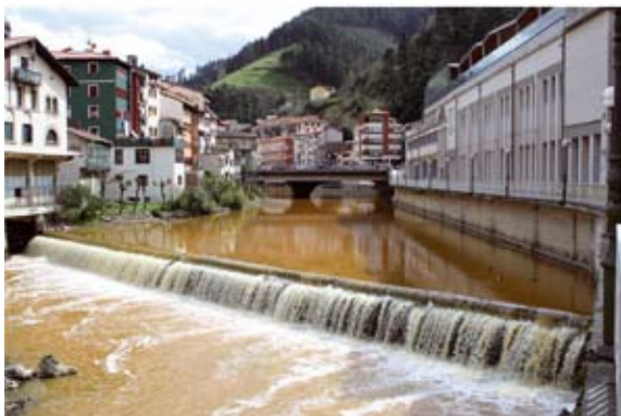
Forja lantzen duen enpresa batek kutsatu zuelakoan daude.