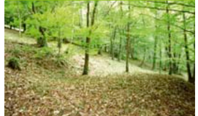
Txondor plazetako bat

Soraluze Baso Bidez egitasmoaren barruan bertako landaredia sustatzeko zuhaitzak landatzen ari dira Lixiba-errekan (Atsedean Txaboleta inguruan). Aipatu zelaiak hektarea eta erdi dauka eta bertan hiru txondor plaza aurkitu dira. Ozuma Baso-lanak enpresa ari da lanean, udalak hala eskatuta.