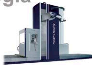
Zutabe Mugikorreko Fresatzeko Zentrua