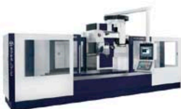
Mahai Mugikorreko Fresatzeko Zentrua