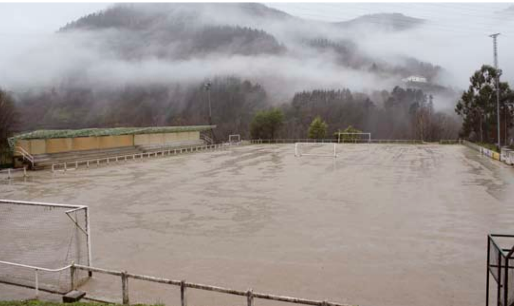
Futbol zelaiari abenduan ateratako argazkia

U dalak Ezoziko futbol zelaia berrizteko 250.000 euroko diru laguntza jaso du dagoeneko, Foru Aldunditik, diru laguntza osoaren %60a. Proiektua moldatu ostean, ekainaren 3ko ple-