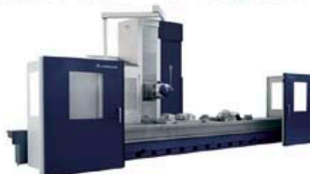
Zutabe Mugikorreko Fresatzeko Zentrua Mahai Finkoarekin