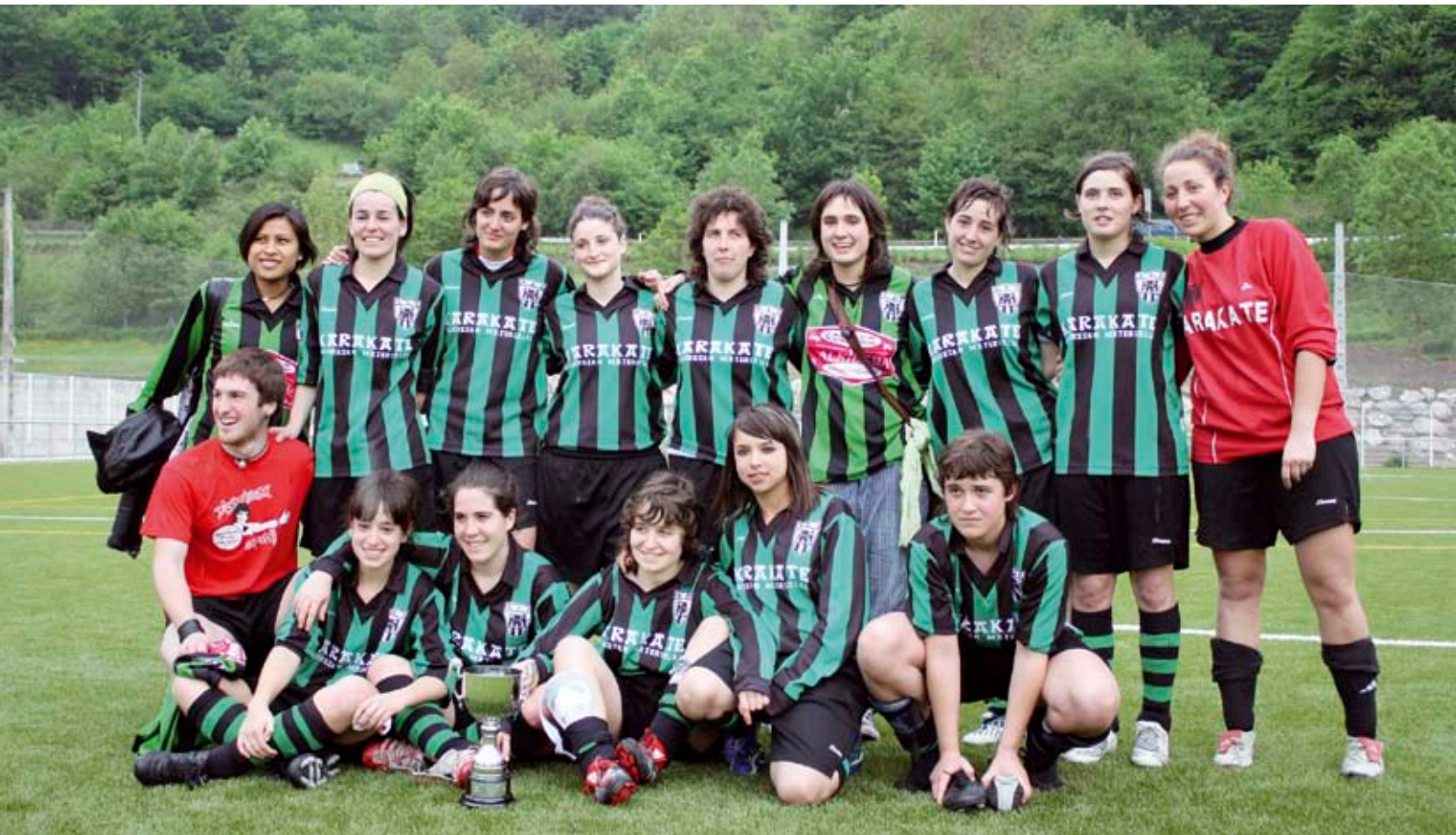
Mondraren kontra Bergaran jokatutako finala galdu osteko argazkia.