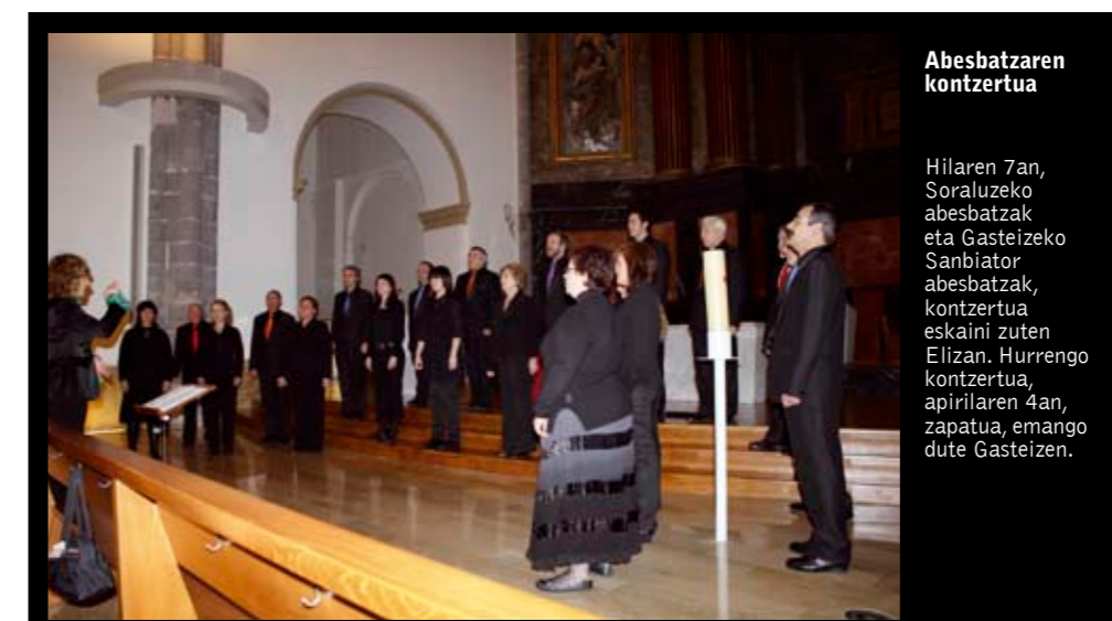
Abesbatzaren kontzertua Hilaren 7an, Soraluzeko abesbatzak eta Gasteizeko Sanbiator abesbatzak, kontzertua eskaini zuten Elizan. Hurrengo kontzertua, apirilaren 4an, zapatua, emango dute Gasteizen.