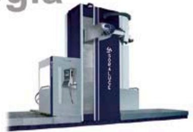
Zutabe Mugikorreko Fresatzeko Zentrua