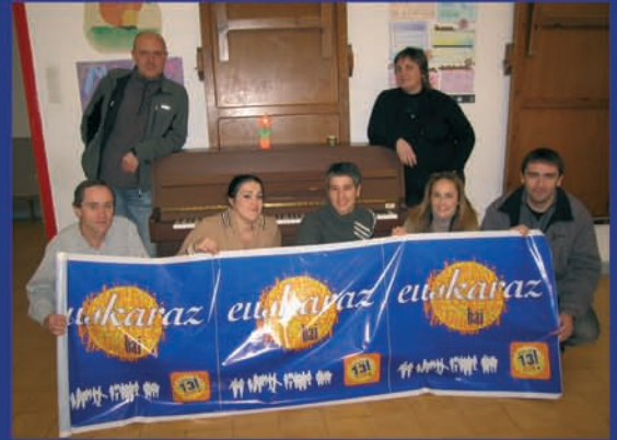
Musika Eskolak, euskaraz bai!