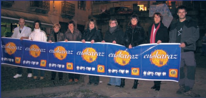
Merkatariek, euskaraz bai!