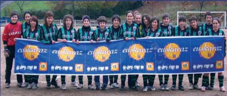
Sorako neskek, euskaraz bai!