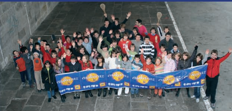
Ikasleek, euskaraz bai!