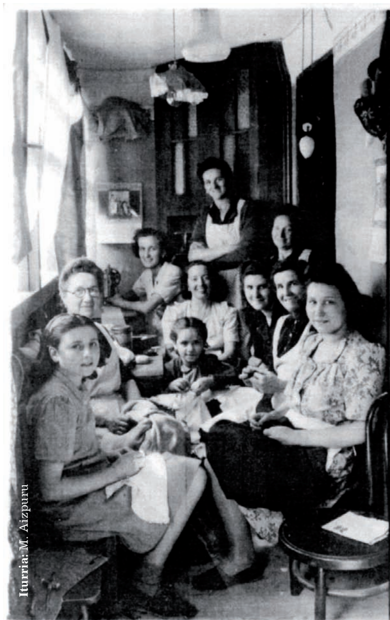
Iturria: M. Aizpuru