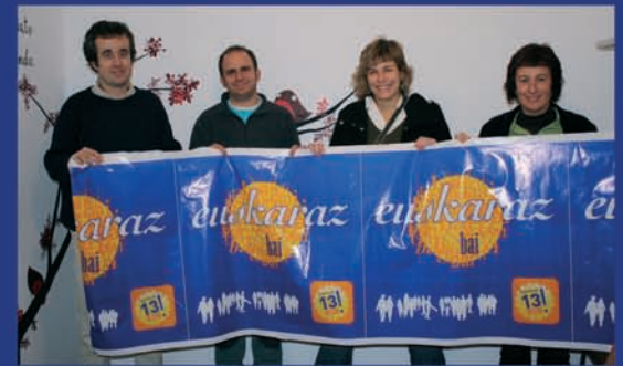
Pil-pileaneko Zuzendaritzak, euskaraz bai!