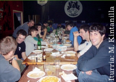
Iturria: M. Kintanilla