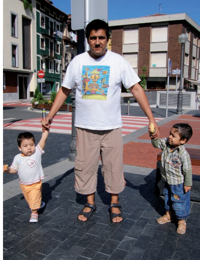
Euskaraz ikasten diharduten seme-alabak ulertzeko ere balioko die.

Irailaren 15a baino lehen eman behar da izena Udaletxeko Euskara Zerbitzuan, 943 75 30 43 telefono zenbakian. ☺