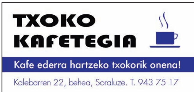
Iturria: I. Aldazabal