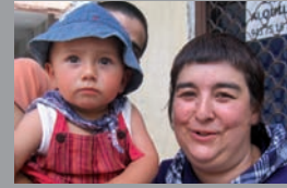
Lur eta Larraitx Abuztuan 14an urtebete eta piku. Zorionak polittak! Muxu bana!