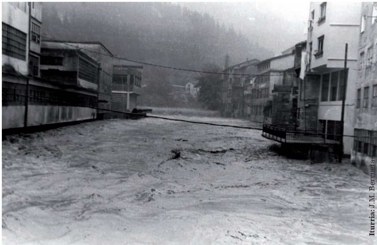
Iturria: J.M. Berrueta