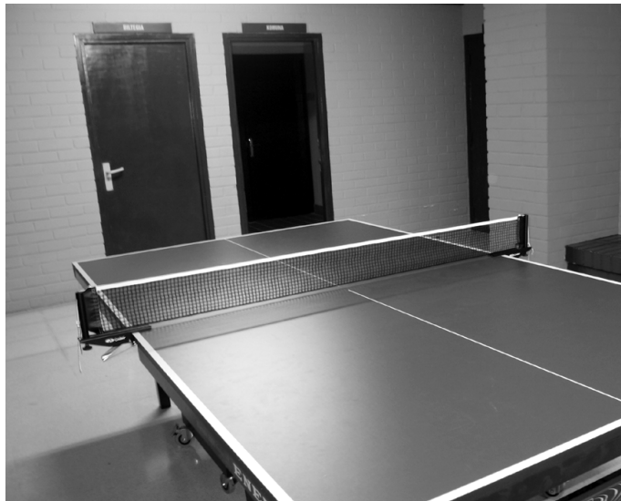
Hall-ean ping-ponga eta futbolina egongo dira

Aspalditik eskatu dute herriko hainbat gazte eta gurasok, batez ere 12-16 urte bitarteko gazteentzat aisialdi eskaintza edo gune bat. Eskaera horri erantzun bat eman nahian Udalak asteburutarako "gazteleku" bat zabaltzea erabaki du. Asteburu honetan jarriko da zerbitzua martxan, Kiroldegiko "hall"-ean.