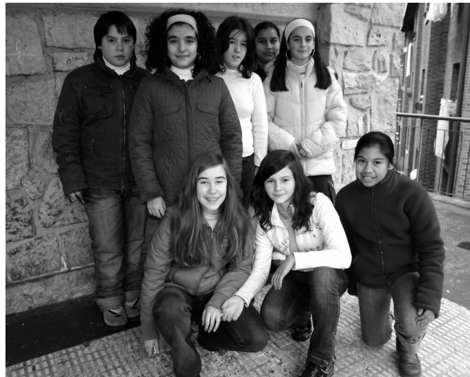
12 eta 16 urte bitarteko ikasleentzat izango da

Keixeta Guraso Elkartearen (Institutuko ikasleen gurasoak) eta Udaleko Kultura eta Gaztedia eta Hezkuntza Sailen arteko elkarlanari esker, Kiroldegiko Kultur gunea Gazteleku bihurtuko da asteburuetan. Gaztetxoentzat gune bat egokituko dute zapatu eta domeka iluntzetan "aterpea izan eta jolasean, hizketan..." jardun dezaten.