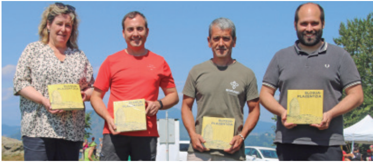
Elgoibarko, Soraluzeko eta Bergarako alkateak eta Aranzadiko teknikaria (ezkerretik hirugarrena) liburua eskutan dutela.