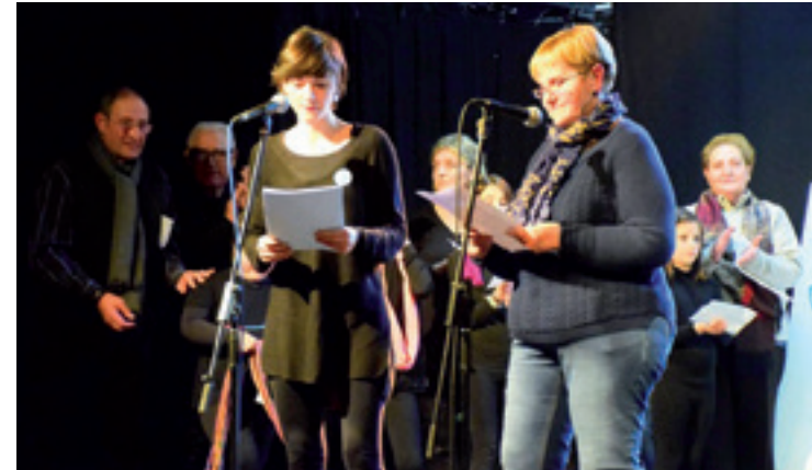
Herriko artista ugari hartu zuten parte, abenduan prozesua abiatzeko antzokian antolatutako zuzen ikuskizunean.

Iaz Debemenek hemeretzi liztor-habia suntsitu zituzten herrian, Foru Aldundiak liztorra deuseztatzeko helburuarekin bultzatu zuen kanpainaren barruan. Aipatutako lanen kostua 1.379,40 eurokoa izan da, habi bakoitzeko 60 eurokoa. 2014an 14 deuseztatu ziren eta 2105ean 9.