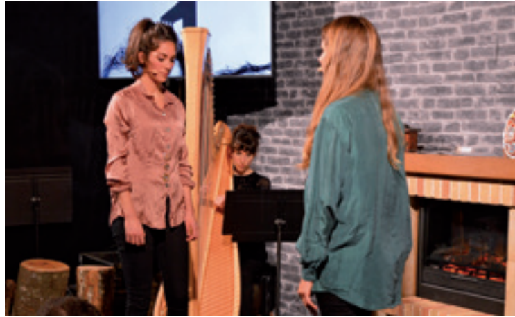
Durangoko Azokan emanaldia eskeini zutenekoa.