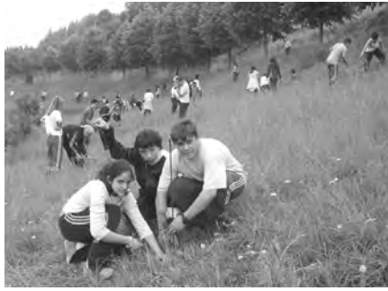
Istitutuko ikasleak Ezozi auzoko lur eremu batean zuhaitzak landatzen.

Erakusketa Ibiltaria ere izan genuen herrian Debabarreneko paisaia interesgarri buruzko gida eta informazioa banatuz. Karakate-Irukurutzeta ezagutze-