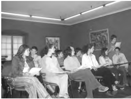
Istitutuko ikasleak Udaleko Batzar Aretoan galderak egiten.

Joan zen astean, Debegesak eta Udalak elkarlanean antolatutako Ekosteanen barruan ingurumenaren zainketarekin zerikusia duten hainbat ekitaldi egin ziren herrian, Agenda 21 proiektuarekin lotuta. Ekainaren 1ean Istitutuko ikasleek herriko "bizigiroa egokia" izan dadin hainbat eskari aurkeztu zituzten Udalari, besteak beste; olio erreka biltzeko zerbitzua (dagoeneko onartua dago mankomunitatean), gai arriskutsu eta altzarien bilketa zerbitzua (ostegun gauetan mankomunitatera abisatuta jasotzen omen dituzte) komun publikoen irekiera (aztertzen ari dira), txakur gorotzak biltzeko poltsak ezartzea, pila kargadore batzuk banatzea eta etxeetan zaborrak banatzeko 200 ontzi oparitzea (idea onak iruditu zitzaizkion Udalari)... Hontaz gain, ekainaren 11n zuhaitzak landatu zituzten Ezozi auzoan.