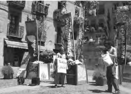
Igandean ikusgai izan zen erakusketa ibiltaria eta herritar batzuen salaketa.

ko irteera bertan behera gelditu zen eta kale antzerkia atzeratu. Balkoi dotoreen III. lehiaketarako datu biltzea ere egin da.