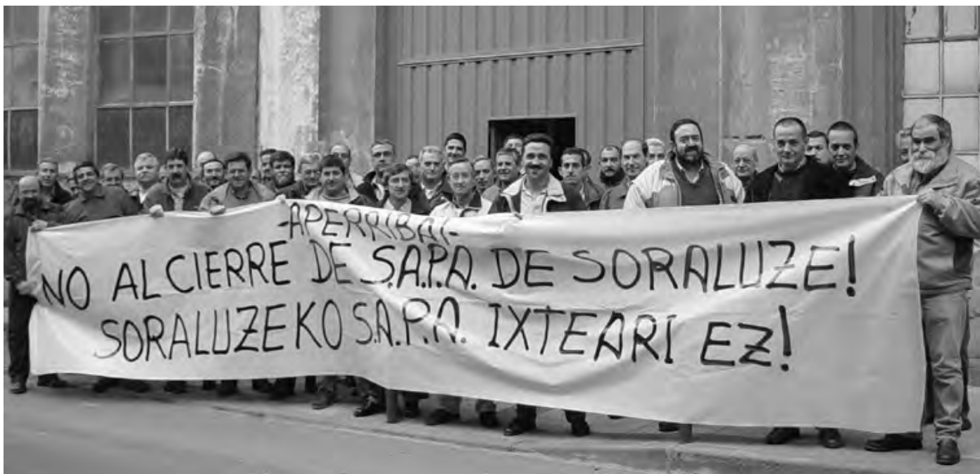
SAPAKo langileek aho batez esan diote ezetz, Enpresako Zuzendaritza Batzordeak hartutako erabakiari.

SAPAKo langileek, Zuzendaritzak lantegia Andoainera aldatzeko hartu duen erabakiaren aurrean, euren eza-dostasuna adierazi dute azken asteotan. Soraluze alderdi politiko gehienekin egin dituzte bilerak eta ondorengo idatzia ere kaleratu dute; "SAPAK XX. mendean hasieran ekin zion bere ibilbideari nahiz eta XIX. mendean ere lan egin zen beste batzuen babesean. SAPAK, Andoaingo lantegia inauguratu zenean jotzen du gailurra ia mila langileekin eta era berean Soraluze lehenengo familien ihesaldia ere hasten da eta baita Soraluze lantegiaren gainbera ere.