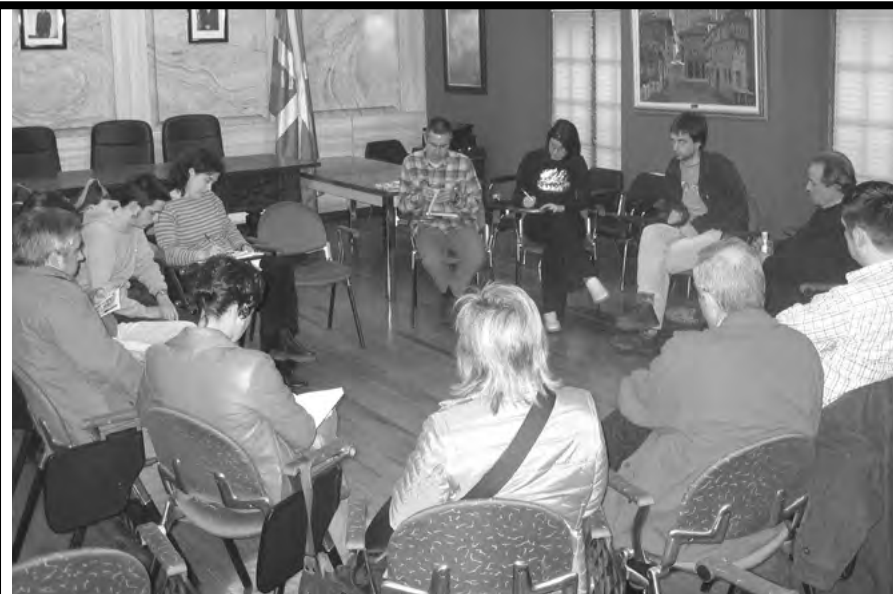
Udaletxeko batzar aretoan bildu ziren, herriko eta auzoetako jaietako antolatzaileak Udaleko Kultura Batzordeburuarekin.

egun Donostia Kultura Patronatuan dihardu lanean. Itzultzaile moduan egindako jardunean honako obrak euskaratu ditu, besteak beste: Zekale artean harrapatuta (J.D. Salinger); Eskerregite eguneko bisitaria (T. Capote); Hau ez da ipuina (D. Diderot); eta Legeen espirituz (Montesquieu). Etorkizunean ere, idazten eta nobelagintzan jarraitzeko asmoa duela esan digu. Hala izan dadila!