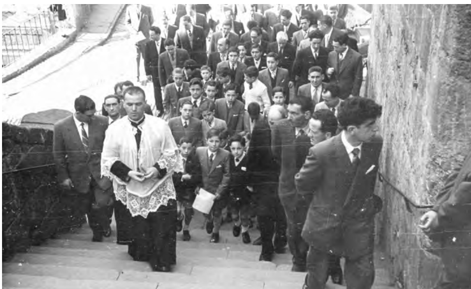
Ascensio, Aste Santuko prozesio baten buruan. Kantuan, ohikoa zuen moduan.