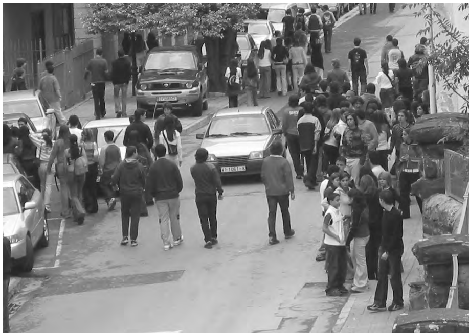
Larunbat arratsaldero bailara osoko herrietatik etorritako gazteak elkartzten dira.

Gazteen artean gaiaren inguruan "gehiegi exageratu" denaren eritzia nagusitzen da; "danok ez gara lurrian zihar