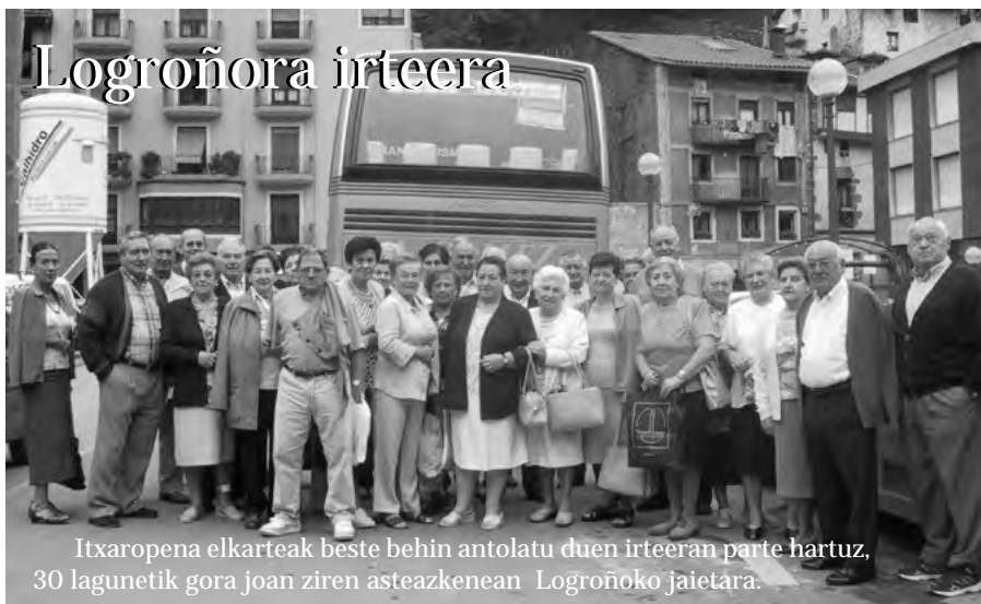
Itzaropena elkarrekin beste behin antolatu duen irteeran parte hartuz, 30 lagunetik gora joan ziren asteazkenean Logroñoko jaietara.

Joan zen ostiralean, 30-en bat lagunek elkarretaratzea egin zuten Plaza Berrian, Herreran gertatutako salatzeke. "Errepresioa ez da bidea!" lelopean, Ertzaintzaren jokoera "errepresioa" gaitzetsi eta "gatazka politikoari benetako konponbidea emateko ordua" dela adierazi nahi izan zuten.