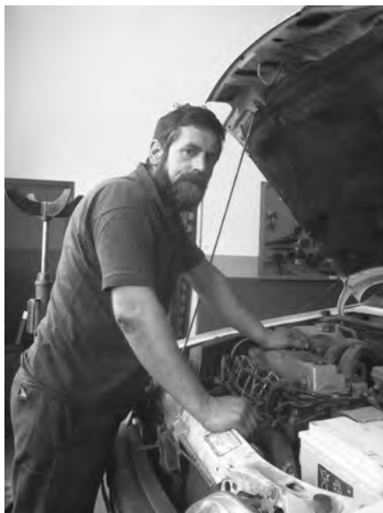
Felix bere lantegian mekanika lanetan.

du eta Eibarrerakoak 0,90ekoa. Gabezi guzti hauek, garraio publikoa alde batera utzi eta norbere autoa hartzera bultzatzen