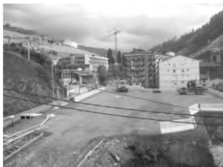
Sazia gaineko aparkamentuak laster izango dira erabilgarri.

Trenbidea. Soraluze eta Osintxu arteko Bidegorriaren egokitze lanak direla eta, trenbidea itxita izango da irailean eta urrian.