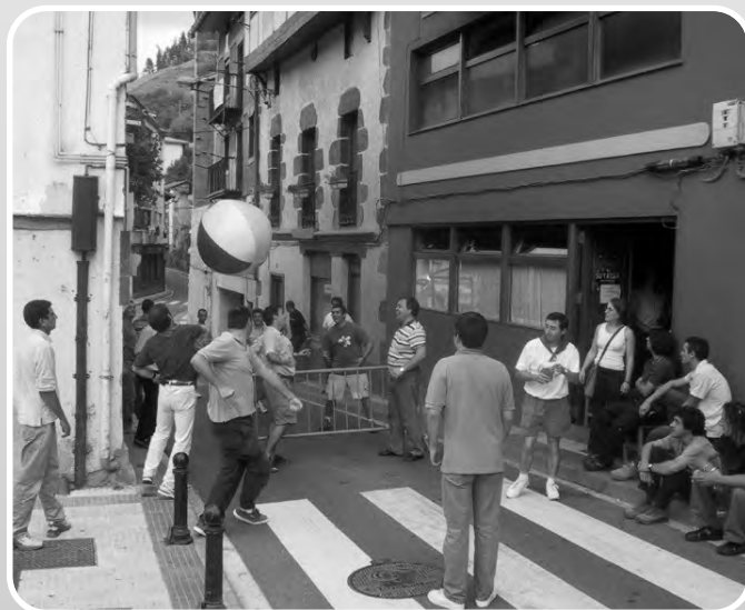
Badira kuadrila batzuk beste batzuk baino ikutu haundixagua daukenak. Zorionez gauerdirako sakabanatu ziran!