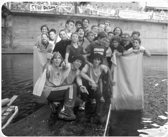
Balsen jeitsiera ikusgarrixa izan zan. Ez horrenbeste hurrengo astietako balsa jeitsiera. Batzuk portatu dira baina....