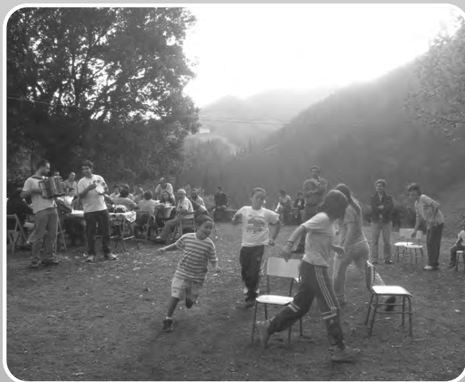
San Martzialera jua zan gaztetxuak majo gozatu eben modu guztietako jokuekin. Joku batzuk amaitezinak izan ziran!