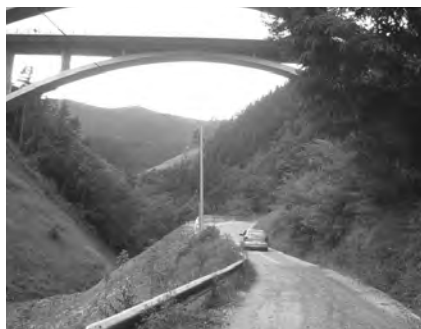
Autopistako lanak Elgetarako bidearen hasierako zatia hondatu dute.

Elgetarako bidea. Aldundiak Sagar Errekatik Elgetarako hasierako bide zatia konponduko duela jakinarazi du.