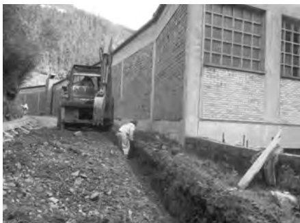
Bidegorriaren argiztapena egiteko, argi indarraren instalazioa egiten dihardute.