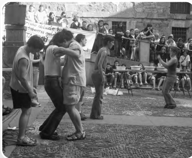
Herri olimpiadetan dana ondo jua zan hankarteko pepinuarrekin arazuak sortu arte. Arrautza jokua be salbaje xamarra!