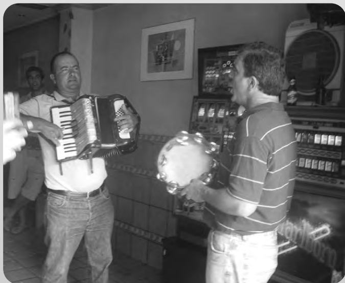
Pablok eta Txilarrek San Roke Txiki egunari urteroko ikutua emon zotsen. Tabernetako DJ eta erregiak izan ziran!