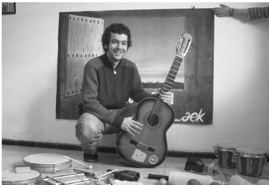
Domentx musika tresnak inguruan dituela eta gitarra eskutan, bere "armarik onena".

"Musika ez da gauza itxi bat. Ez dago pentagrametan, ez dago partituretan. Kanpoan dago. Ahaztu solfeoak eta dibertitu".