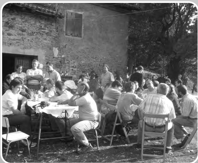
San Martzialgo mus txapelketara jende mordoxka batu zan. Ideia haundirik barik, askok suertia probatu nahi izan zeber!