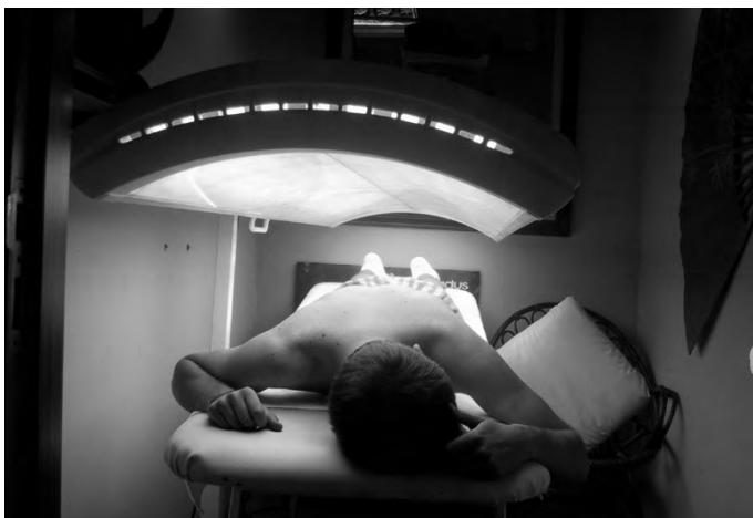
Solariumera joateko aukera ere badago. Erabiltzaileen esanetan eguzkia hartzea baino erosoagoa eta eraginkorragoa da.

Badakizue, eguzkia hartzea ondo dago, baina behar diren neurriak hartuta.