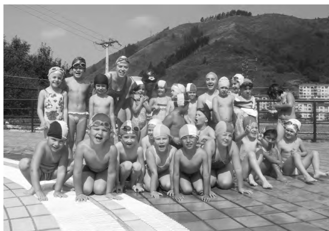
Aste honetan bertan joan dira udaleku irekietako gaztetxoak Eibarko igerileku irekietara. Eguzkia hartzeko, astirik ere ez!