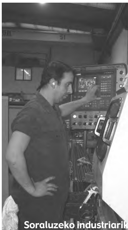
Soraluzeko industriaririk gehiena metal arlokoa da

Abenduaren 31an azken bi urteetan indarrean izan den Gipuzkoako metal arloko lan hitzarmena iraungi zenetik, Gipuzkoako enpresaburuen elkarteak (Adegi) eta sindikatu nagusiak metalgintzako lan hitzarmen berria sinatu ezinik dabilta. Ezadostasun horren ondorioz, ostiral honetan ELA eta LABek deituta laugarren greba eguna egin dute Gipuzkoako metalgintza arloko langileek.