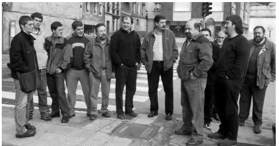
Langile eta ordezkariak atzoko greba eguneko Arrasateko manifestaziora joateko zai.

Soraluzeko industriaren zutabe nagusia metal arloan jarduten duten enpresa eta lantegiek osatzen dute; GOL, SAPA, FER, Irazola, Carmelo Mendizabal, Unamuno, MAH, Urreztarazu eta beste hainbat eta hainbat lantegik. Ehundaka dira Soraluzeko lantegietan lan egiten duten soraluzetar edo inguruko herritarrek. Gipuzkoako metal arloko lan hitzarmen berriak adostu ezker eragin handia izango luke Soraluzeko langilariaren zati oso garrantzitsu batean. Gerta daiteke ordea hitzarmenik ez sinatzea eta orduan azkenengo hitzar-