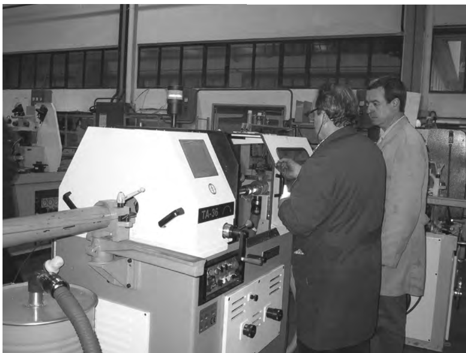
Unamuno lantegiko langileek grebetan parte hartu dute gainontzekoekiko elkartasunez.

"Hitzarmen orokorra da garrantzitsuena eta horretarako enpresak ADEGI presionatu bihar dabe"