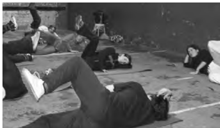
Aerobikekoek Batzokiko frontoian jarraitzen dute eguneroko entrenamenduetan.

Alkateak bere aldetik, idatzi bat kaleratu du aerobik-eko idatziari erantzunez.