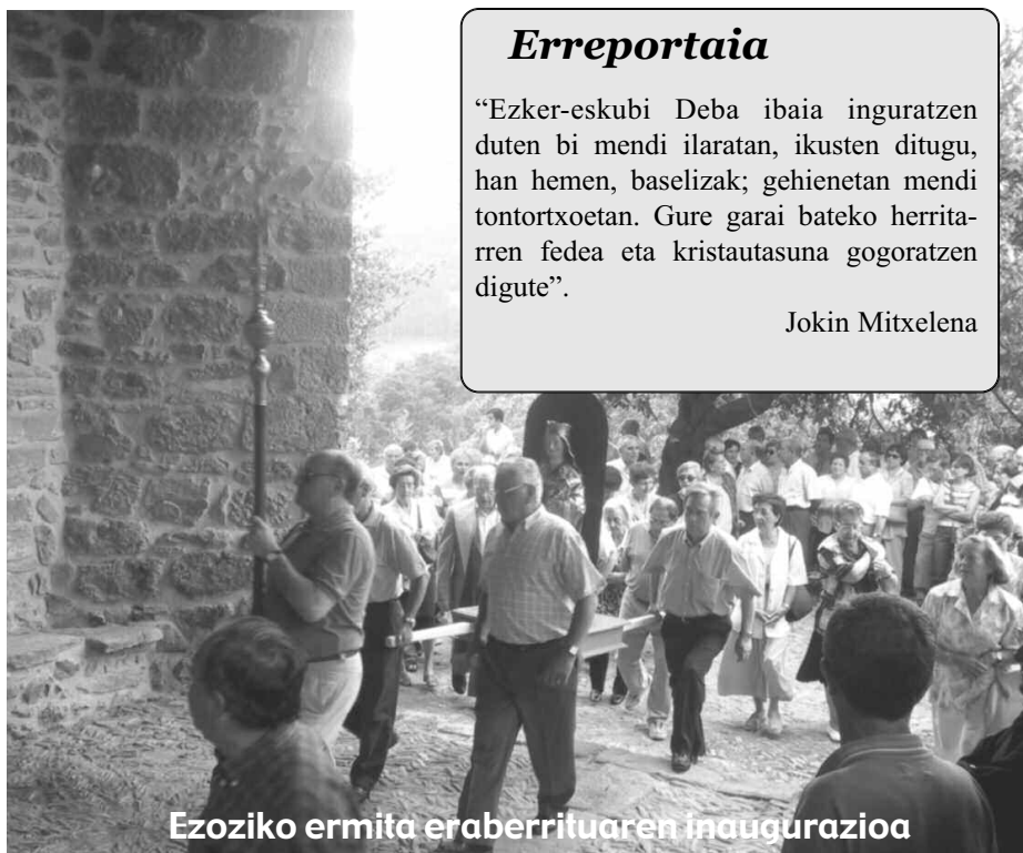
Ezoiko ermita eraberrituaren inaugurazioa