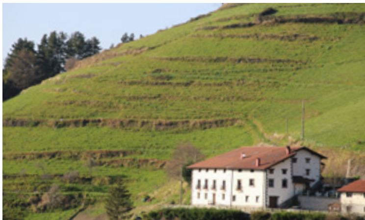
Oraindik ere muga askok bere horretan diraute zelai eta baso askotan.

Soraluzekoa ingeniari-taldea harrigarria da, gizakia ingurune naturala bere beharretara moldatzeko (modu jasangarrian) egin dezakeenaren adibide ikusgarria. Izan ere, Soraluzeko maldak mugaz eta hormaz josita daude. Zelaietan ageri dira batzuk, baina ezkutututa daude beste asko, azken hamarkadetan landatutako pinadiak estalita. Sinesgaitza badirudi ere, garai batean sail horiek denak labratutako soro ziren, eta baliatzen ziren garia, artoa, baba eta abar landatzeko -historia iturrien arabera, basoak soro bihurtzeko prozesua IX. eta XIII. mendeen artean gertatu zen-. Emaitza: garai hartan, gaur ez bezela, Soraluze ia buruaskia zela elikadurari zegokionez.