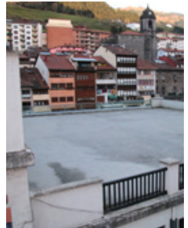
Solairu bat gehituko diote.

Bertan parte hartuko dute kirol teknikariak, kirol zinegotziak eta proiektua idatzi duen udaleko arkitektoak. Udalak herritar guztiak gonbidatu nahi ditu bertara, batez ere, herriko kirol eragileak.