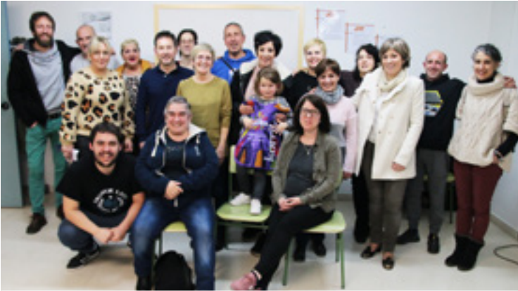
Hainbat taldetako ordezkariak batu ziren batzordearen lehen bileran.