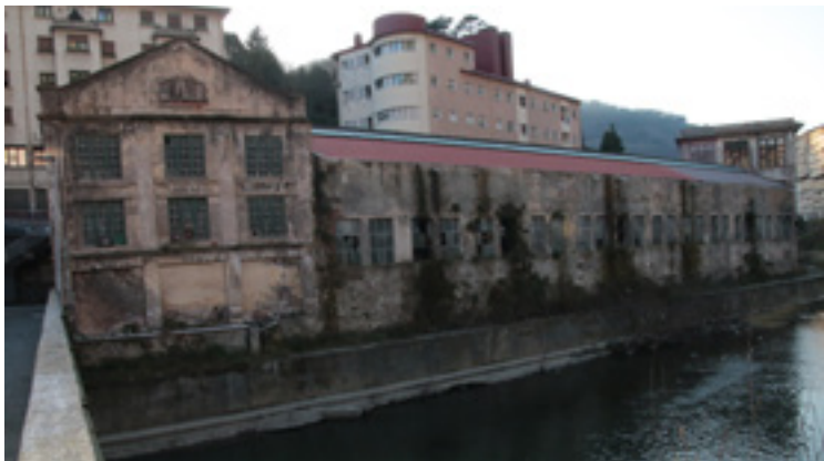
Soraluzeko Udalari lagapenez emango dioten SAPAko eraikina.