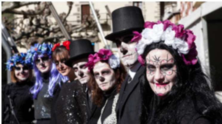
lazko aratusteetako argazkia.