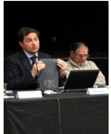
Historia liburuaren aurkezpena, iaz.

Liburuaren bidez, 1962an sortu zenetik gaur arte egin duen ibilbide teknikoa eta teknologikoa azaldu nahi dute eta balioa eman "etorkizuna eraikitze"ko.