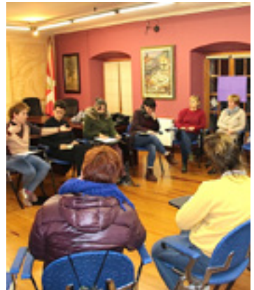
M8 Plataformaren batzarra.

Euskal Herriko Mugimendu Feministaren deialdiarekin bat eginez, bost esparrutan oinarritutako greba-deialdia egin dute: pentsionistak, ikasleak, zaintza, enplegua eta kontsumoa. Eta parte hartzeko modu ugari daude: "Lantoki eta ikasgeletan greba eginda; hiri eta herrietako mobilizazioetara joanda; zaintzeari utzita eta hori irudikatzen amantala balkoian eskegita; gure eskualde edo arloan greba antolatuta; besoko morea eta txapa ipinita grebarekin bat egiten dugula adierazteko...".