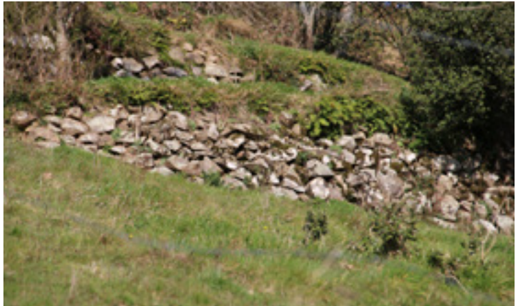
Harria bistan duten mugak, Kortako etxe azpiko lursailean.

Aldundiak argitaratutako datuen arabera, Soraluze da Gipuzoako herririk aldapatsuena. Soraluzeoko mendi magalek lur-geruza oso mehea dute arbelaren gainean; horrenbestez, eremu euritsua izanda, urak mendian behera eroaten du soildutako lurra. Halabaina, Soraluzeoko baserritarrek jakin zuten arazo horri errotik heldu eta irtenbidea bilatzen. Itxura batean desabantaila zirudiena, abantaila bihurtu zuten: aldapa. Izan ere, urak behar bezala bideratu ostean, lur aldapatsuak lauak baino baino bizkorrago izaten dira prest labrantzarako, hezetasun gutxiago pilatzen delako eta eguzkiak lehenago lehortzen dituelako.