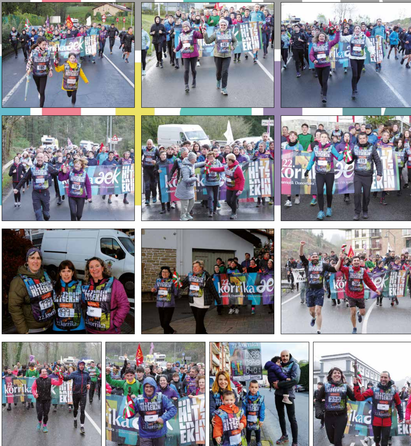
Mallabiko lekukoak: Pilota Taldea, Mendibil Abesbatza, Gazte Alai Dantza Taldea, Biharko Izarrak, Jubilatu Elkartea, Mallabiko Udala, Goimek, Mallabiko Eskola eta Gurasoen Elkartea, Mallabiko EH Bildu, Askalde, Txondor Herri Kirolak, Mallabiko Berbalagun, Nahikari Emakumeen Elkartea eta AD Mallabia FT.