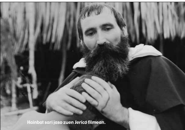
Hainbat sari jaso zuen Jericó filmean.