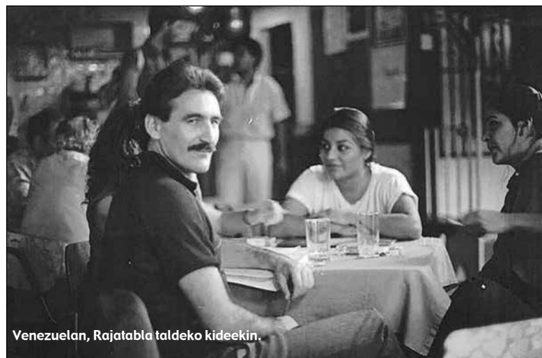
Venezuelan, Rajatabla taldeko kideekin.