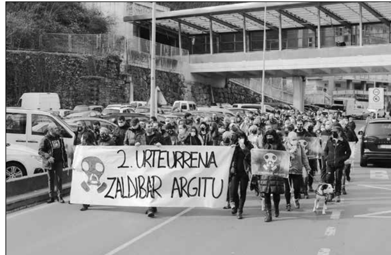
Otsailaren 6an burututako manifestazioa.

Batzuk bai, baina ez zekiten hain handia zenik, ezta hain