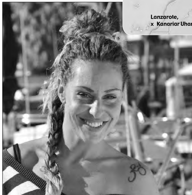
Lanzarote, x Kanariar Uharteak

Hotel batean egiten dut lan masajista bezala, eta horrez gain masaje enpresa daukat, mugikorraren bitartez kontratatu daitekeena. Hoteleko lankideengandik asko ikasten dut eta, nahiz eta autonomoak izan, talde sendoa osatzen dugu, familia bat bezalakoa.