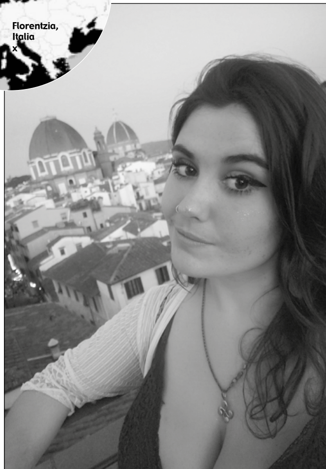
Alazneren atzean, Florentziako Santa Maria del Fiore basilika.

Giroa. Jende asko dago, herrialde ezberdinetakoa, eta gazte