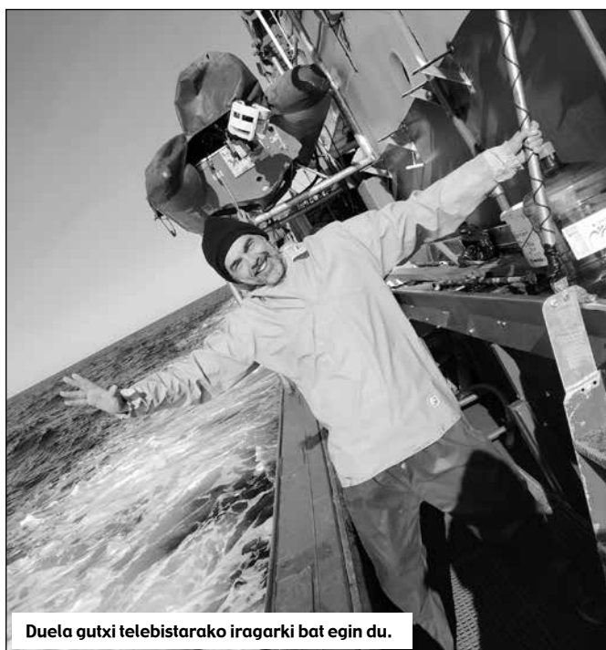
Duela gutxi telebistarako iragarki bat egin du.