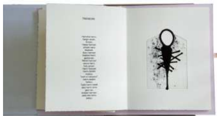
Ezkerreko bi irudietan "Bertatik Bertara" liburua egiteko erabili diren kobrezko plantxak eta azken emaitza. Eskuinean, Lanzaroten dagoen "Begirada altua" eskultura.

"Ez zait interesatzen zerbait zehatza esatea, interesatzen zaidana norbaitekin konektatzea da". Norbaitekin konektatzen duzunean ixten da benetan egile-obra-ikusle hiru; gehienetan ikuslea da, bere emozio eta kultur ondarearekin, obra osatzen duena.