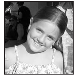
Urriaren 1ean Zorionak! Muxu asko etxekoan partez. Prestatu belarriak!!!

Iragarkia edo zorion-agurra kaleratzeko, bidali mezua: drogeten@gmail.com helbidera. Azken eguna: Urriaren 16a.