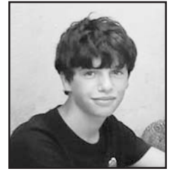
Irailaren 15ean Zorionak Peru! Primeran pasa dezazula zure urtebetetzean. Patxo handi bat etxeko guztion partez!