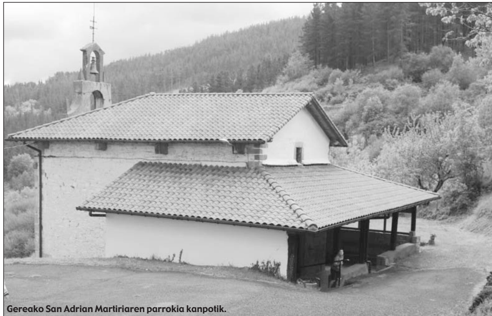
Gereako San Adrian Martiriaren parroikia kanpotik.

Dokumentazioa: Derion, Bizkaiko Elizaren Histori Artxiboan gordetzen dira bertako agiri guztiak, besteak beste kontu-liburuak, Calahorrako gotzaitegi-