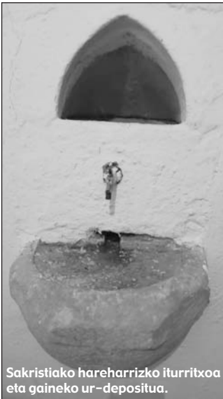
Sakristiako hareharrizko iturritxo eta gaineko ur-depositua.

Auziak: Hermita izatetik Parrochia izatera pasatzen denean, bertan abade bat biziko dela erabakitzen da. Berorri Ziortzako Kolexiatak 6 dukat ordainduko dizkiola edo hamarrekoen bere ekibalentzia, eta Bolibarko Cabildoak 13 dukat eta lehen fruitu edo primizien zati bat. Eliztarrak arduratuko dira elizaren konponketez eta behar diren kaliz eta eliz jantziez. Arazo eta desadostasun ugari izan zuten auzokideek Bolibar eta Zior-