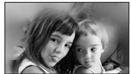
Lur (uztailak 12) 8 urte Izar (abuztuak 2) 2 urte Zorionak marimatrakak! Maitte zaittuztegu!

Iragarkia edo zorion-agurra kaleratzeko, bidali mezua: drogeten@gmail.com helbidera. Azken eguna: Urriaren 16a.