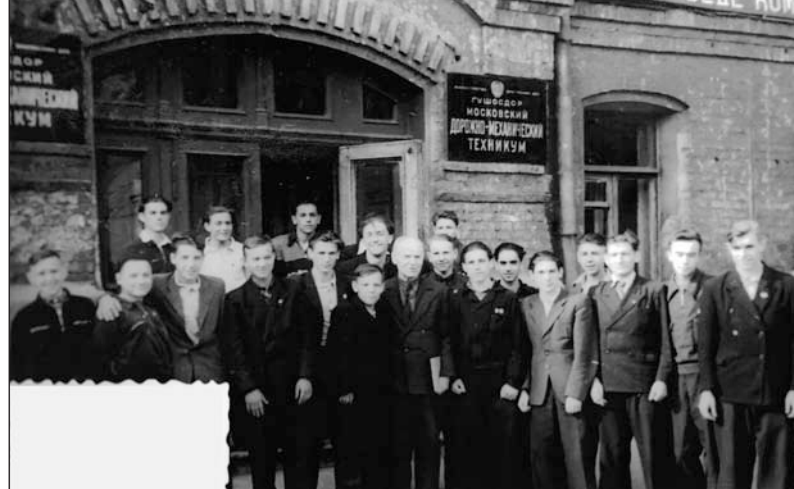
Eskola teknikoan egin zituen ikasketak Moskun

netariko arropaz betetako maleta eman eta Moskura bidali ziguten bueltan, Bolshhevara zehazki. Han amaitu genuenean inork ez zigun esan zer egin eta eskolatekniko batera joatea erabaki nuen. Errepide eta Zubien Eraikuntza karrera egin nuen Moskun, Bakunin kalean.