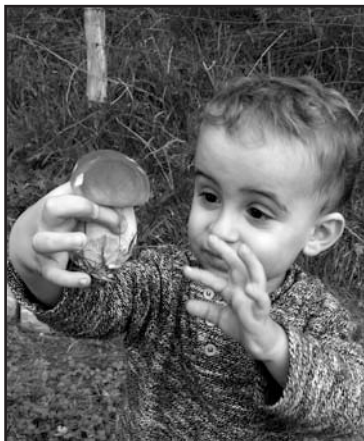
Abenduaren 30ean Zorionaaak prexioso!!! 2 urtetxo! Etxeko danon partez patxito potolo bana. Asko maitxe zaitxugu, segi horren alai!!