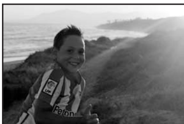
Urtarrilaren 21ean 9 urte egiten ditu . Zorionak gure etxeko txapeldunari! Muxu pila familiakoen partez!