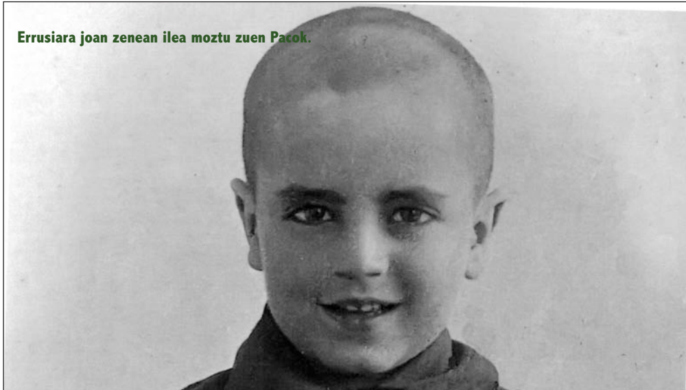
Errusiara joan zenean ilea moztu zuen Pacok.

- Gazteleraz edo errusieraz jasotzen zenituzten klaseak?