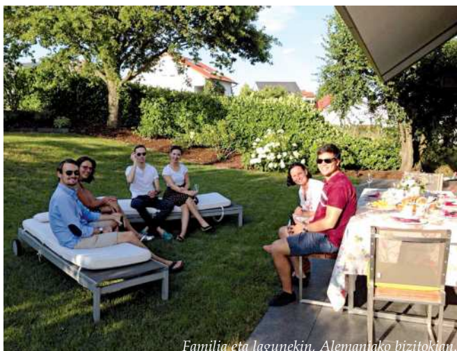
Familia eta lagunekin, Alemanian bizitokian.