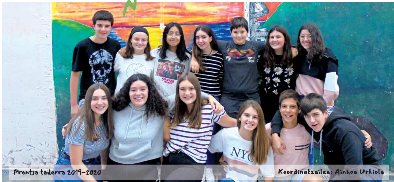
Prentsa tailerra 2019-2020