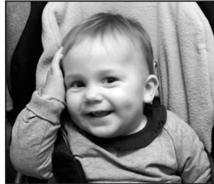
Martxoaren 20an Zorionak etxeko txikiari! Askoko maite zaitugu!