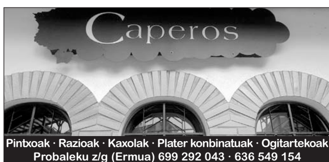
Drogeteniturrri, 265 zk.