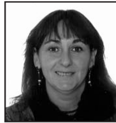
Urriaren 3an Zorionak Piedi zure urtebetetzean fami- liaren partez! Musu asko eta asko maite zaitugu!