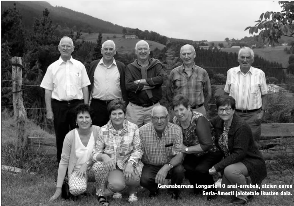
Gerrenabarrena Longarte 10 anai-arrebak, atzien euren Geria-Amesti jaiotetxie ikusten dala.

V: Bai, baina txandakaxandaka barriro indartu bihar izaten da, sustrai barrixe edo zeoze ipiñi biher dotsezu, bestela... Hartutako konpromisue, eindako botuek urtero barrizatzen doguz Kongregaziñuen; aste beteko Gogartiek, Ejerzixuek ein eta amaittueran botuek barrizatzen doguz.