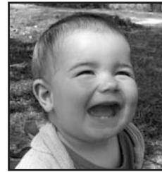
Urriaren 10ean Zorionak Xabat! Patxo potolo-potolo bat eta besarkada haundi bat etxeko partez!