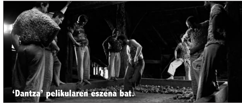
‘Dantza’ pelikularen eszena bat.

Aste santuan Belchiten (Zaragozan) izan ginen