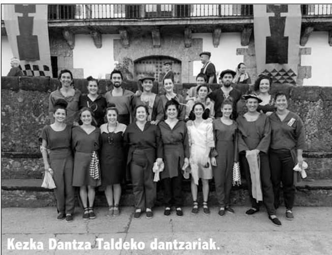
Kezka Dantza Taldeko dantzariak.