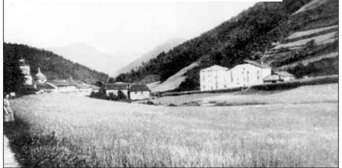
San Pelayo inguruko lautadak, garitza bat ziraneko sasoiaren.

akorduen. Zaku haundi batzutan ekarten eben, garandute eta astuari ondo lotute. Baskulan pisau, laga hantxe eta Eibarrera jutzen zian, merkaurer. Guk urundu eta bixamonerako prest eukitzen genduen. Orduen etxerik ez Errotabarririk harutz eta Eibartik bueltan etozienien, urrinera ikusten nittuzan astuok, Garziamonen etxie baiño beheragotik, autopistian sarrerie baiño harutzagotik.