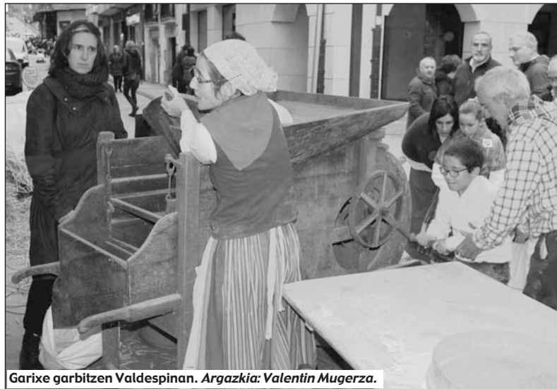
Garixe garbitzen Valdespina.

Apartekorik ezebez! Azkenengo hilgoran ereinda dago, egutegi biodinamikuan ze egun dan apraposena begiratu ostien eta oin lurpien 9 hillebete ein bihar dittu, uztaillera arte, orduen dalako batzeko sasoie. - Berue biher dau garixek. Ein dau heltzeko besteko arue?