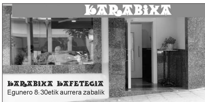
KARABIXA CAFETEGIA Egunero 8:30etik aurrera zabalik