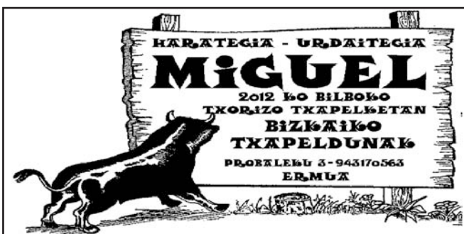
Drogetenituri, 250 zk.