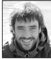
Urriaren 21ean Zorionak aitaxito! Aurten urtebetetzea Ermuan pasatuko duzu, topera disfrutatu! Maite zaitugu! Araia eta etxekoan partez, musu bat!