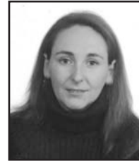
Urriaren 3an Zorionak guapa!! Musu handi bat familiaren partez eta ondo pasa zure eguna.