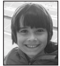
Irailaren 19an Zorionak Aiur, 10 urte!!! Segi hain alai eta maitekor, musu asko familiaren partez.