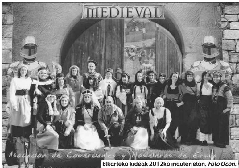
Elkarteko kideak 2012ko inauertietan.