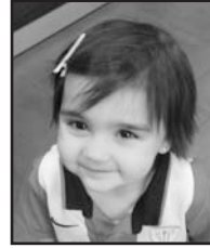
Abuztuaren 20an Zorionak Lexuri etxekoen partez, eta musu handi-handia Aitzolen partez.