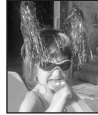
Uztailaren 12an Zorionak Lur!!! Jarraitxu betiko moduan hain txaplata eta jator! Maitxe zaitxugu!!