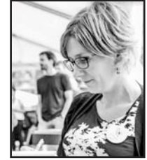
Uztailaren 26an Zorionak Lorea!! aurten ospakizun handia merezita gainera!! Musu handi bat!!