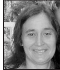
Ekainaren 10ean Zorionak amatxo zure seme-alaben partez. Ondo pasa zure eguna eta musu asko.