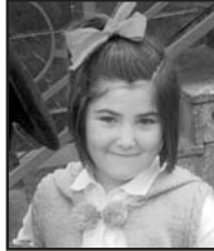
Maiatzaren 24an Zorionak June. 7 urte zoragarri pasa dira. Muxu handi bat familiaren partez.