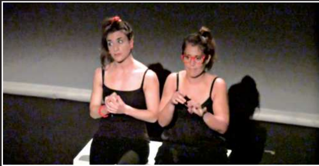
"Izan ala ez izan". Zurriolako Antzerki Eskola