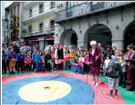
"Ongi etorri FindeMundo!". Trapu Zaharrak