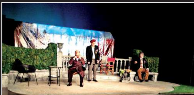
"Heroiak". Txalo Antzerki Taldea