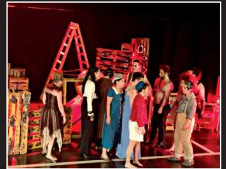
"Zapoi, hil arte edan!". Karrika Taldea