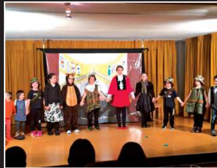
"Txanogorritxo". Aizarnako Eskola Antzerkia