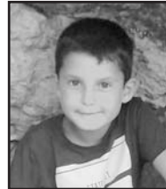
Abenduaren 11n Zorionak Urko familia guztiaren partez. Musu handi bat txapeldun! Asko maite zaitugu.