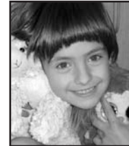
Abenduaren 10ean Zorionak Uxue familia osoaren partez eta musu handi bat.