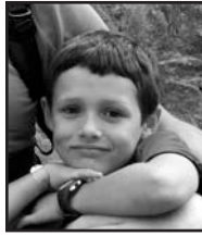
Azaroaren 12an Zorionak Xabat!! 7 urteko mutil koxkorra! Primeran pasa eta segi horren alai eta jator!!! Aitatxo, amatxo eta familia.