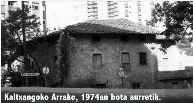
Kaltxangoko Arrako, 1974an bota aurretik.