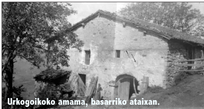
Urkogoikoko amama, basarriko ataixan.

Abeletxe Aizti Antonatxa Arrako Betiondo Elorretabekua Elorretagoikua Errekalde Errotabarri Espilla Infreñu Joxio Karabixa Motxu Ongarai Orozko Otxua Santukua Sinko Tellerixa Torrekua Torreta Trake Txantxikua Ureta Urkobekua Urkogoikua