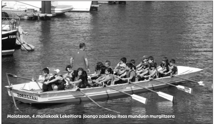
Maiatzean, 4.mailakoak Lekeitiora joango zaizkigu itsas munduan murgiltzera

Gure eskolako 5 urteko kideek Itsaso munduan sartuta ibili dira 3 astetan zehar. Denen artean itsasontzi ederra egin dute inauterietan ITSASOA gaia adierazteko eta esfortzu handiak egin dituzte koloreak, forma, tamaina eta abar erabakitzeko gelako talde guztien artean. Itsasontziak, "Polita" hain zuzen ere, liluraturik utzi gaitu ikusi dugunean, ikusgarria benetan! Aratusteak pasatu dira eta "Polita"-k beste betebeharra izango du: Garraioak gaia ikasiko dutenez sakonki ikasiko dute nola-koak diren benetako itsasontziak.