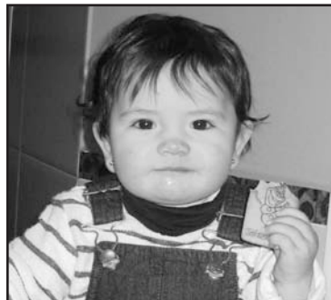
Martxoak 12a: Zorionak Ama! gure printzesak urtebete! Amatxo, aitatxo eta Ermuko familiaren partetik. Muxu handi bat!

Hurrengo zenbakirako azken eguna: APIRILAREN 20a