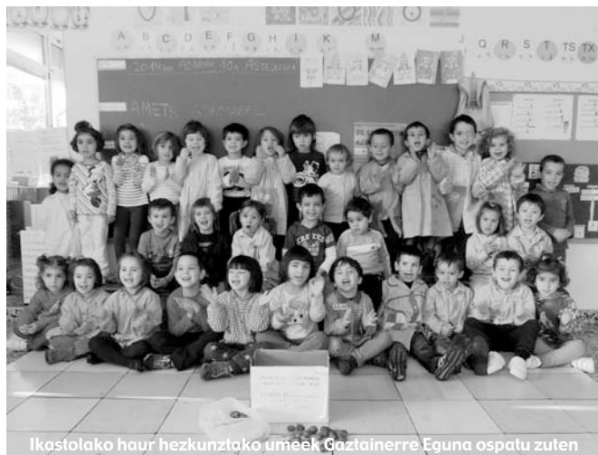
Ikastolako haur hezkuntzako umeeek Gaztainerre Eguna ospatu zuten