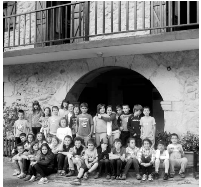
ra. Gure abentura zoragarria bukatu zen, oroitzapen atseginak bakoitzak barnean ditugularik.

Baina mundu honetan hasierak bukaera duen moduan etxera itzultzeko ordua etorri zitzaigun. Batzuk etsipenez, beste batzuk, ordea, pozik eta nekatuta baina denok gustu-