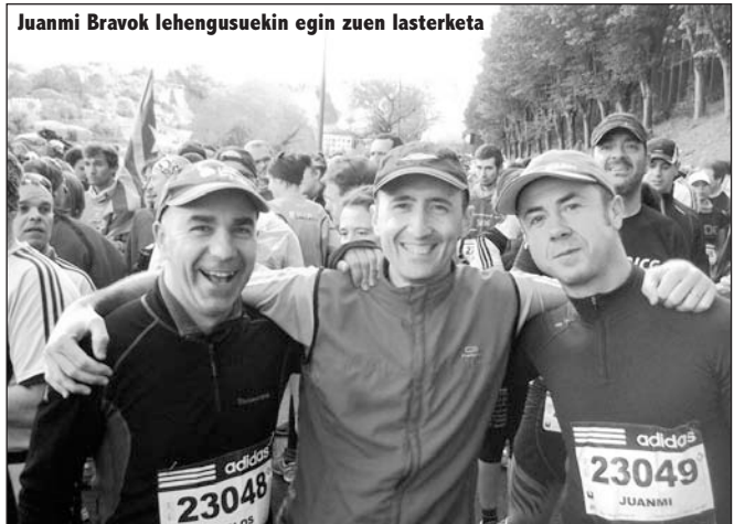
Juanmi Bravok lehengusuekin egin zuen lasterketa

Laugarren aldia da Behobia-Donostian parte hartzen