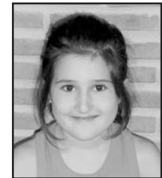
Uztailaren 3an Zorionak Libe familiaren partez!! Musu handi bat, neska jatorra!

Hurrengo zenbakirako azken eguna: IRAILAREN15a