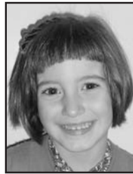
Apirilaren 8an Zorionak txapel-duna, bost urte bete dituzu jada. Besarkada eta musu potolo bat zure familiaren partez.