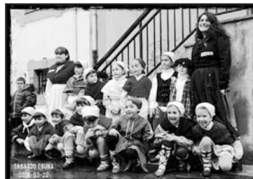
Martxoaren 22an Zorionak Txindurriko dantzari txikiei! Martxoko egun euritsu honetan debuta egin zuten taldeko gaztetxoenek, hasi aurretiko urduritasuntxo tarte eta plaza bete begien aurrean. 50 bat urte barru-edo, argazki honi begiratuta, dantzarekin hasierako honetan beste disfrutatzen jarraitzea opa diegu!

Hurrengo zenbakirako azken eguna: MAIATZAREN 19a