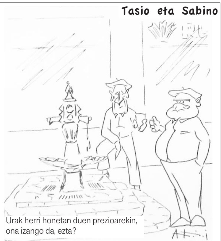
Urak herri honetan duen prezioarekin, ona izango da, ezta?