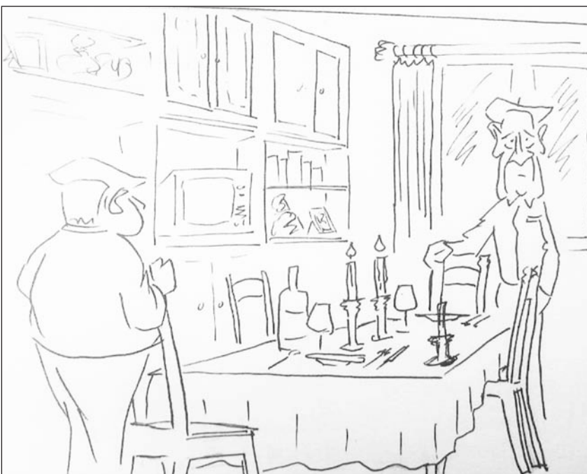
Oier Abarrategi, 30 urte

- San Valentínekofa afaria prestatzen? Noren zain zaude ba?