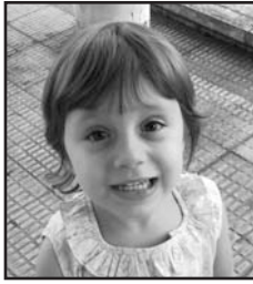
Otsailaren 12an Zorionak Mare zure 4. urtebetetzean. Musu asko familia guztiaren partez eta oso ondo pasa zure egunean.